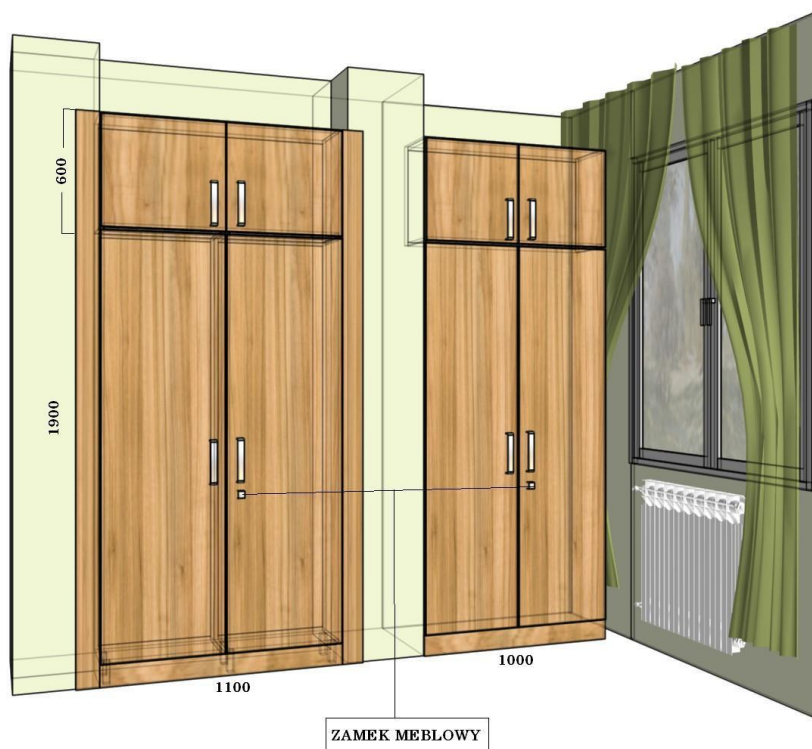
Rys. 2. Szafy ubraniowo-aktowe