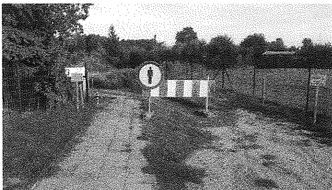
Rys.1. Zakaz ruchu pieszych umieszczony na krańcach inwestycji.