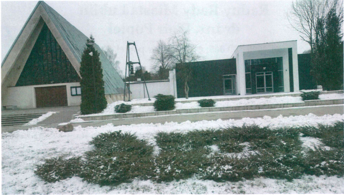
Fot. 1. Kaplica pogrzebowa i sala pożegnań na cmentarzu komunalnym przy ul. Droga Męczenników Majdanka 71.