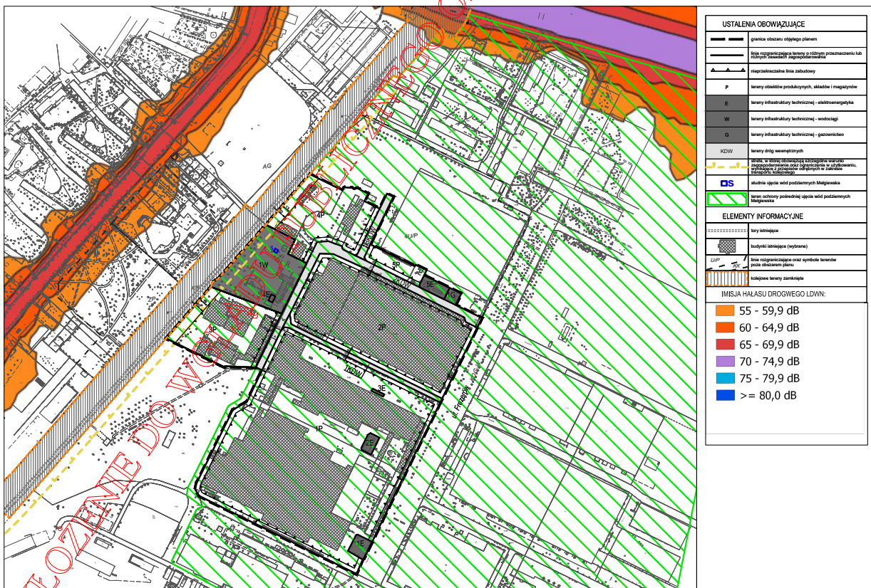
Rysunek 1: Imisja hałasu drogowego LDWN w granicach projektu zmiany planu i w najbliższym sąsiedztwie. (źródło: opracowanie własne na podstawie obowiązującej mapy akustycznej dla miasta Lublina).

Klimat akustyczny – Projekt zmiany planu nie wprowadza funkcji podlegających ochronie akustycznej. Aktualnie w obszarze opracowania nie występuje emisja hałasu drogowego, natomiast w części zachodniej obszaru występuje emisja hałasu kolejowego. W obszarze opracowania występuje również emisja hałasu przemysłowego pochodzącego z zakładu zlokalizowanego w obszarze opracowania, jak również z zakładów sąsiadujących z obszarem opracowania. Realizacja ustaleń projektu zmiany planu nie będzie w sposób istotny wpływać na klimat akustyczny tego obszaru, z uwagi na usankcjonowanie pełnionych funkcji.