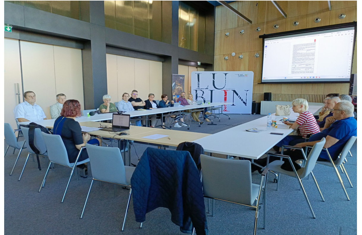
Spotkanie z przedstawicielami Rad Dzielnic 20 września 2023 r