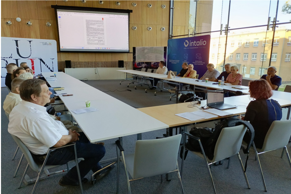
Spotkanie z przedstawicielami Rad Dzielnic 20 września 2023 r.