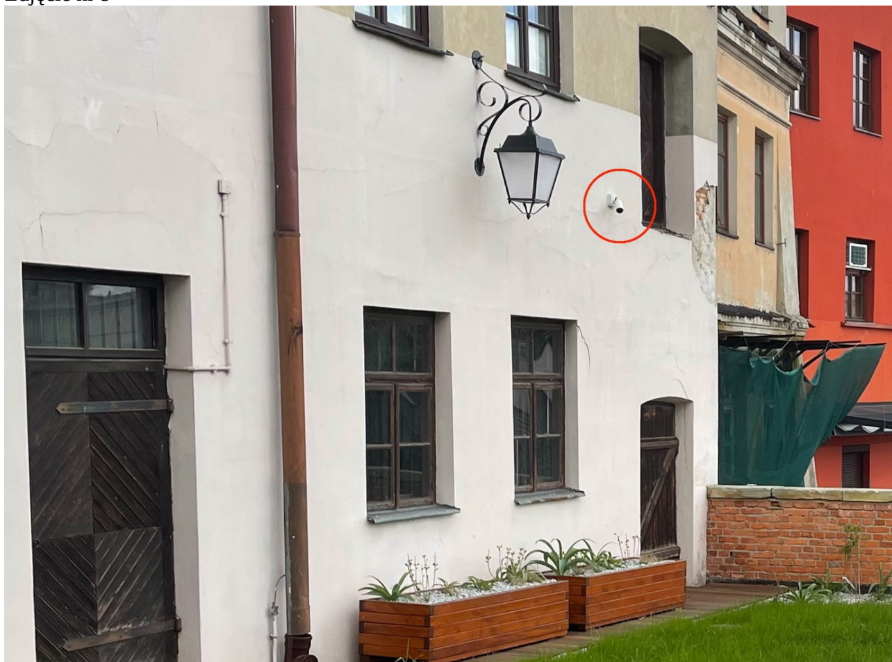
Zdjęcie nr 9

3. W załączeniu „Decyzja Lubelskiego Wojewódzkiego Konserwatora Zabytków znak: IN.5174.19.1.2023” dot. kamienicy przy ul. Grodzkiej 11 w Lublinie oraz „Decyzja Lubelskiego Wojewódzkiego Konserwatora Zabytków znak: IN.5142.426.2.2023” dot. zespołu klasztornego o.o. Dominikanów w Lublinie.