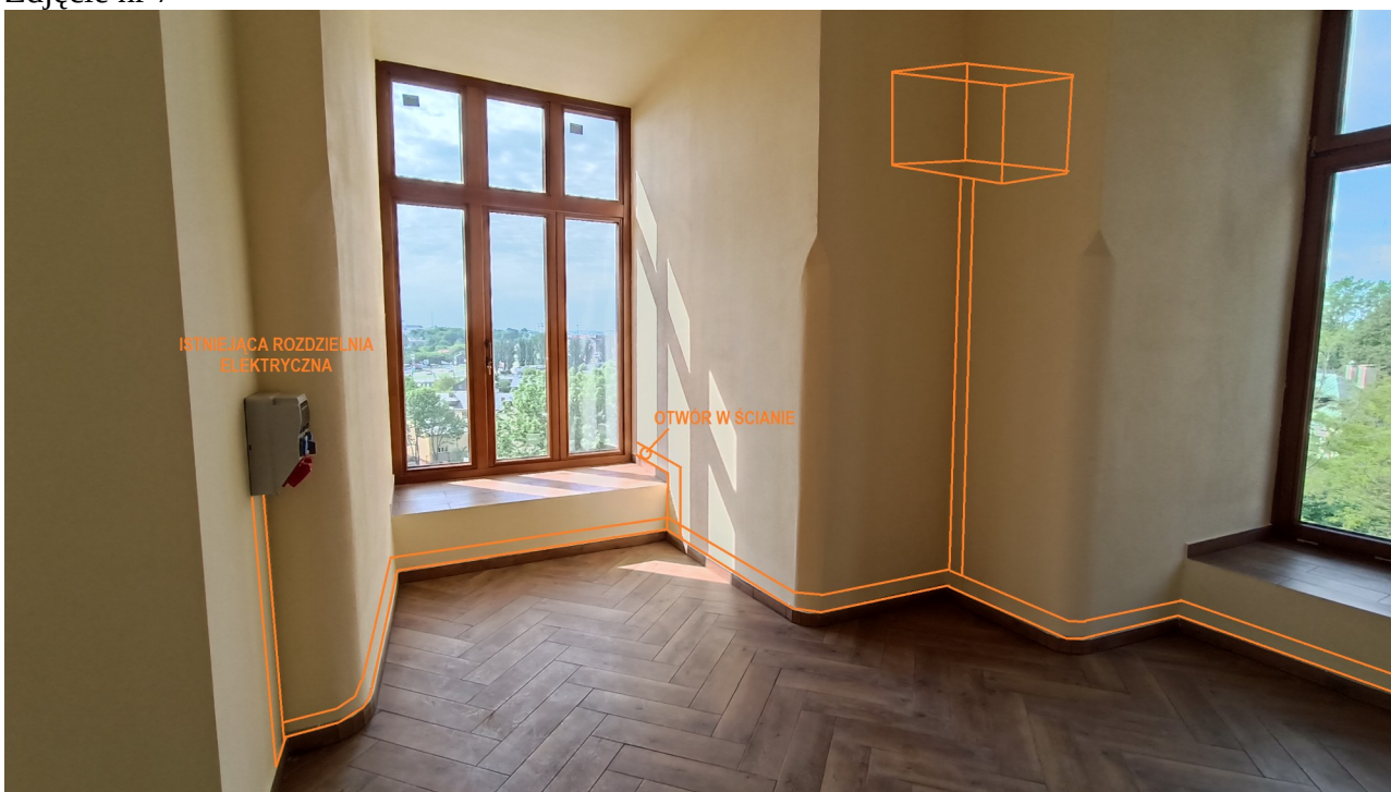
Zdjęcie nr 7

Prowadzenie kabli teletechnicznych wewnątrz budynku oraz miejsca zaznaczenia przewiertów w okolicy okna zaznaczono na zdjęciach nr 7 i 8.