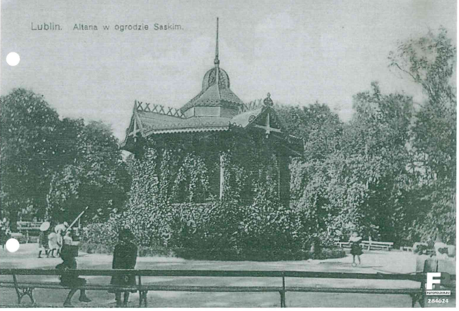
Lublin. Altana w ogrodzie Saskim.