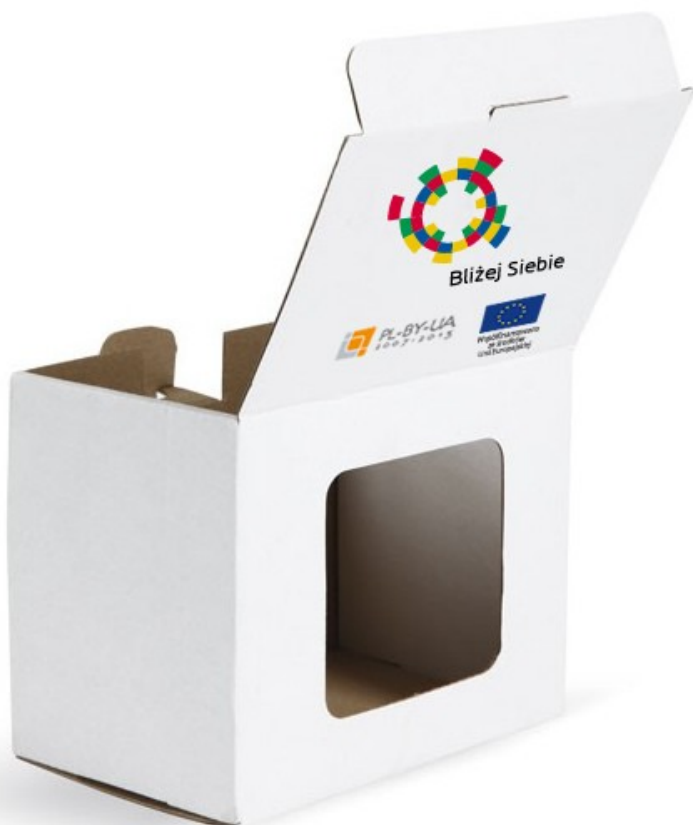
Projekt 3b: Opakowanie na kubek