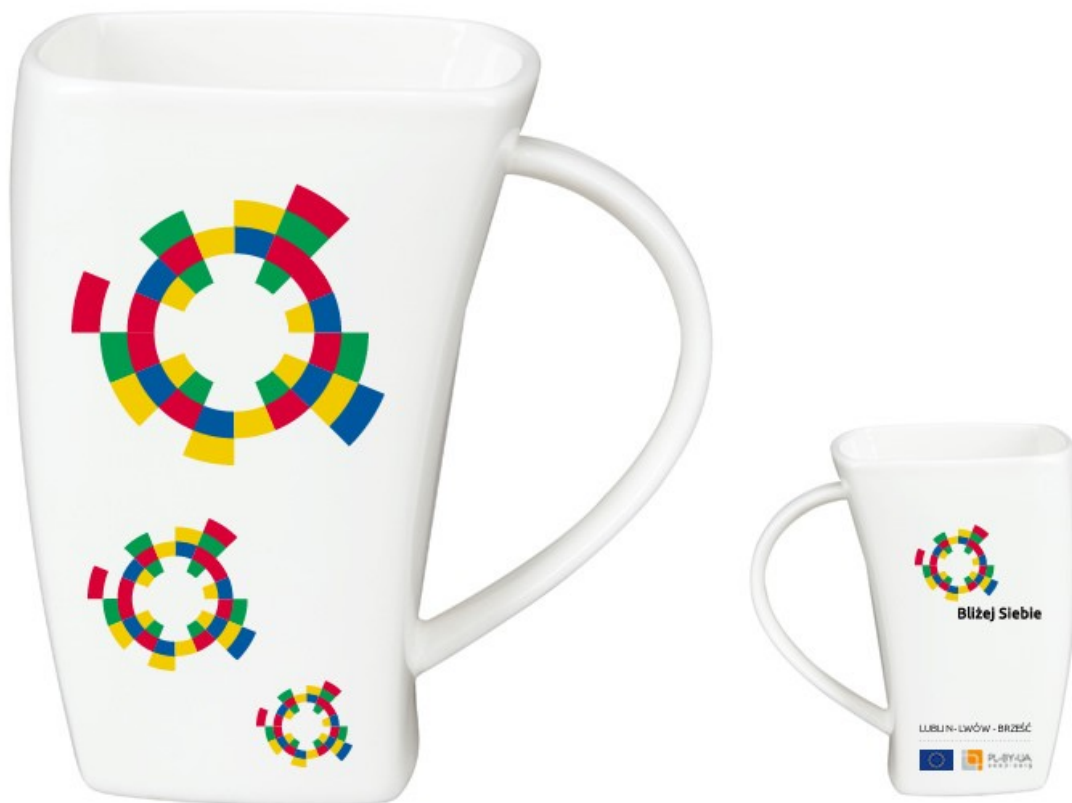
Projekt 3a: Kubek