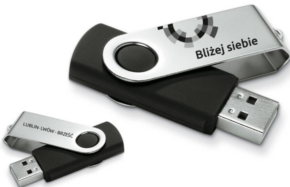
Projekt 2: Pamięć przenośna USB

Nakład: 100 szt.: czarne – 50 szt.; białe – 50 szt.