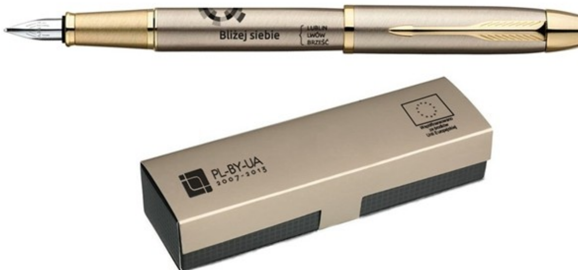
Projekt 1: Pióro wieczne w etui