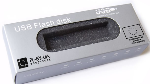
Przykładowe etui na pamięć przenośną USB