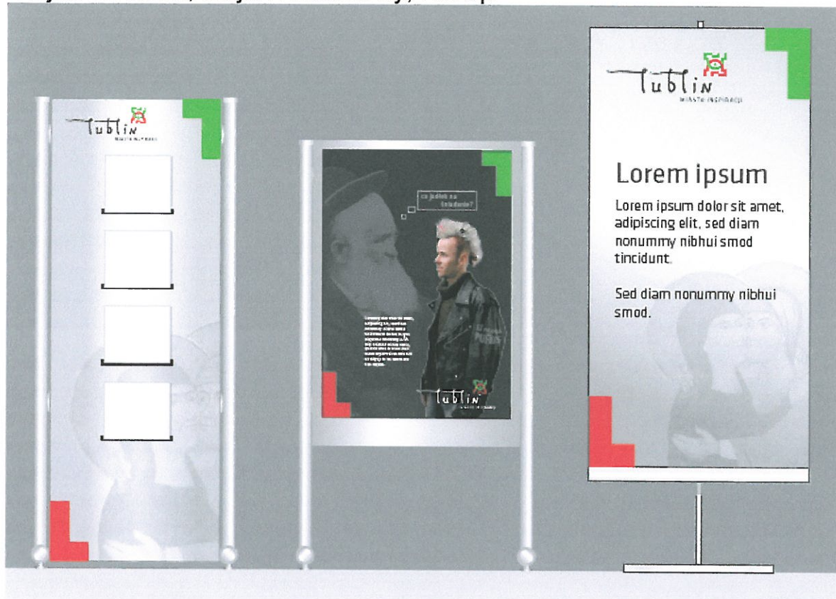
stojak na ulotki

Stojak na ulotki, stojak reklamowy, roll-up