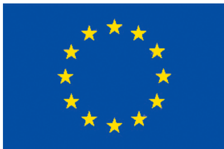
Rys. 3 Flaga UE

Drugim obowiązkowym elementem, który należy umieszczać promując działania w ramach PO RPW, jest emblemat Unii Europejskiej z odwołaniem słownym do Unii Europejskiej i Europejskiego Funduszu Rozwoju Regionalnego.