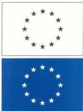
Rys. 5 Jednobarwne wersje flagi UE

Jeżeli jedynym dostępnym kolorem jest czarny, prostokąt powinien posiadać czarną obwódkę, natomiast gwiazdy powinny być czarne na białym tle. W sytuacji, gdy jedynym dostępnym kolorem jest niebieski (oczywiście musi to być odbity niebieski/Reflex Blue), tło powinno być wydrukowane w maksymalnym nasyceniu tym kolorem, z pozostawionymi na tle białymi gwiazdami.