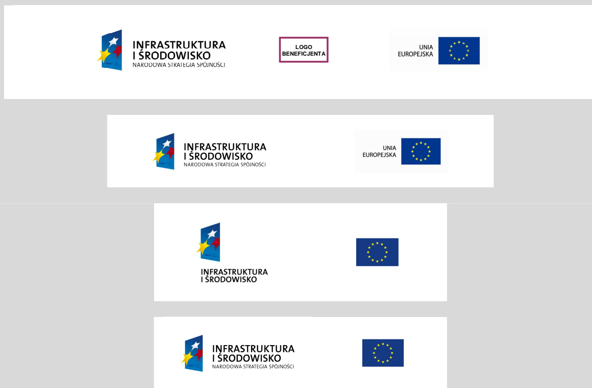
Rys. 2 Minimalny wariant oznaczania materiałów informacyjnych, promocyjnych i szkoleniowych

Przykładowe zestawienia ciągu znaków w formatach AI, CDR, GIF, JPEG, PNG są dostępne na stronie internetowej www.pois.gov.pl w zakładce Zasady promocji .