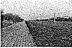
Załącznik nr 1.2. - Miejsce budowy przystanka Jaspisowa.jpg 286 KB