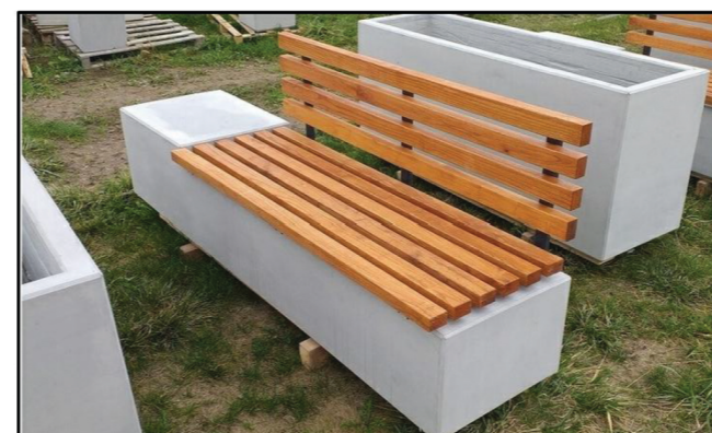
4. proponowana ławka z drewnianym siedziskiem