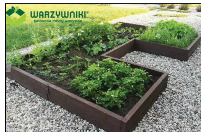
7. proponowany wyniesiony nad poziom gruntu warzywnik z gotowych elementów betonowych