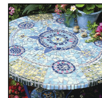
8. proponowane wykorzystanie mozaiki jako motywu przewodniego