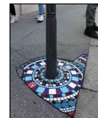
6. proponowane wykorzystanie mozaiki w nawierzchni