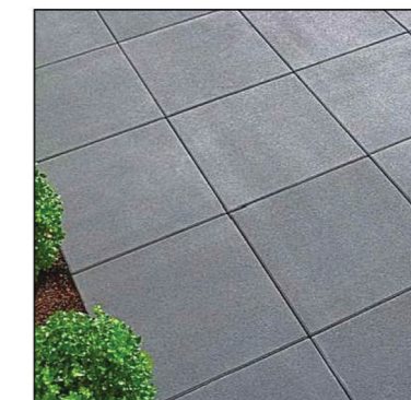
3. nawierzchnia z płyt betonowych 60x60