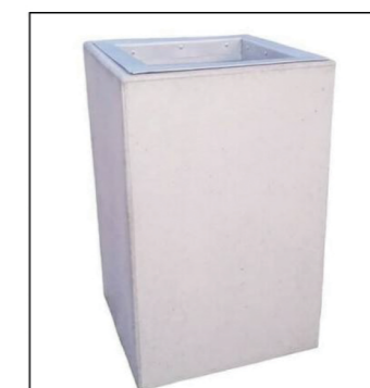
9. kosz na śmieci