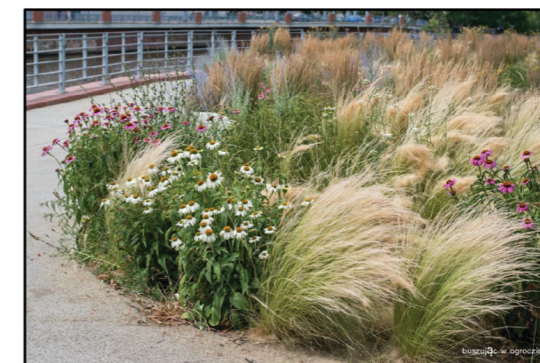
5. proponowana rabata z traw ozdobnych