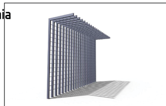
1. trejaż- zróżnicowany wysokościowo tak by nie zastonić muralu