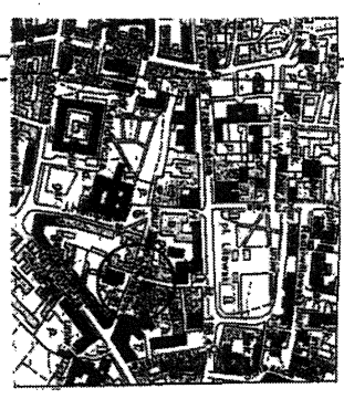
ORIENTACJA 1:10 000

Linie rozgraniczające strefy do ustanowienia służebności przesyłu oraz strefy pasa roboczego określono na podstawie wyznaczonych inwestora.