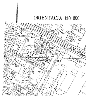
ORIENTACJA 1:10 000