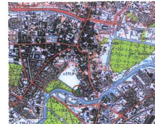
Orientacja Skala 1:40 000