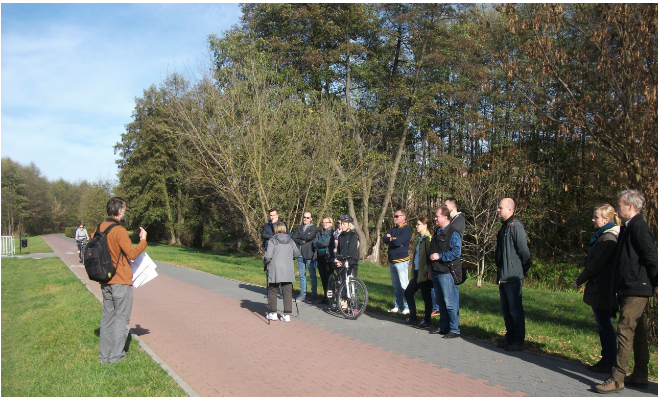
Fot. 14. Ciąg pieszo – rowerowy w rejonie ul. Parczewskiej.