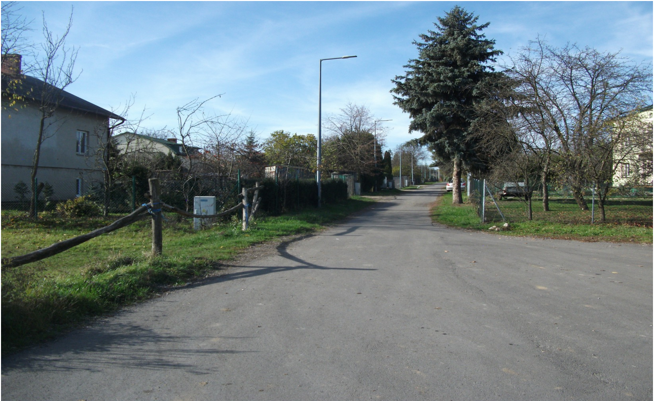
Fot. 11. Rejon ul. Parczewskiej.