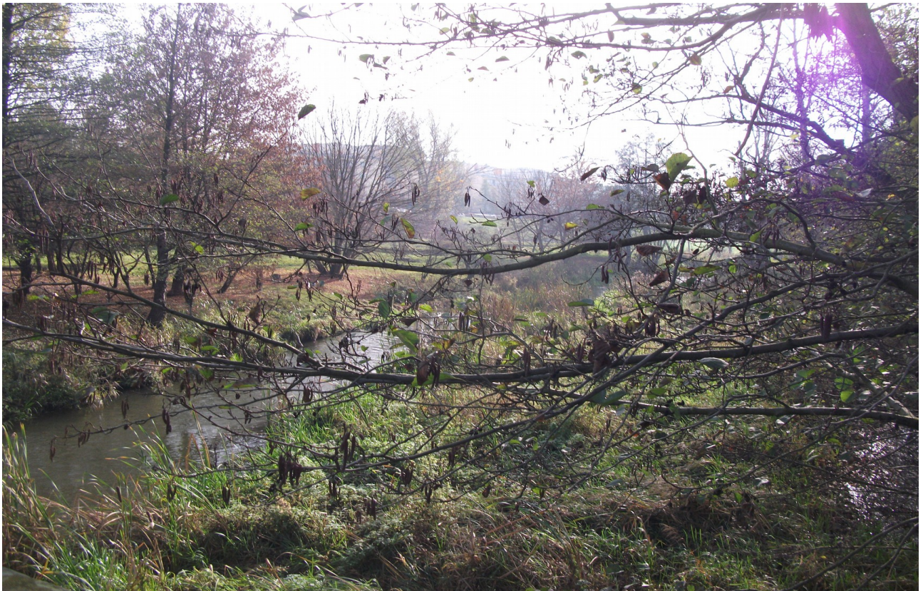
Fot. 8. Rejon ul. Janowskiej, widok z kładki pieszo – rowerowej.