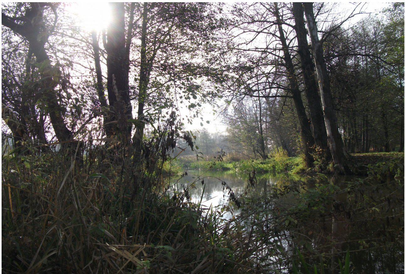
Fot. 6. Okolice os. „Łąkowa” w rejonie kładki pieszo - rowerowej.