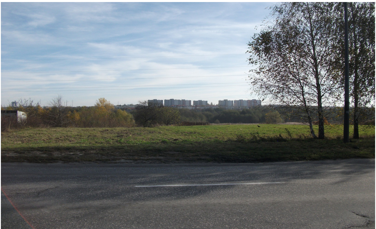
Fot. 10. Rejon ul. Janowskiej, w tle panorama os. Nałkowskich.