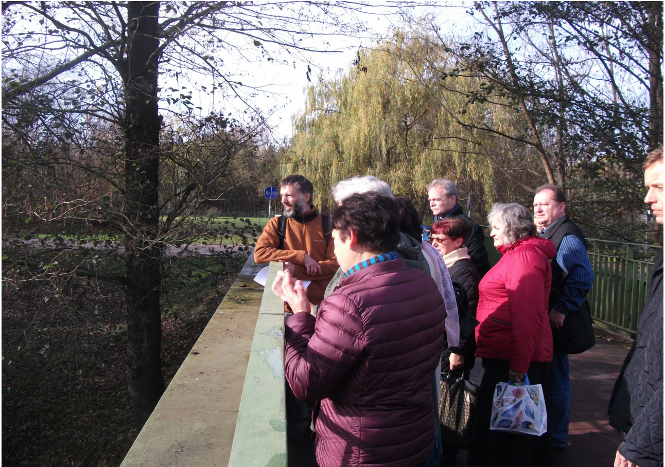
Fot. 7. Kładka pieszo – rowerowa , rejon ul. Janowskiej.