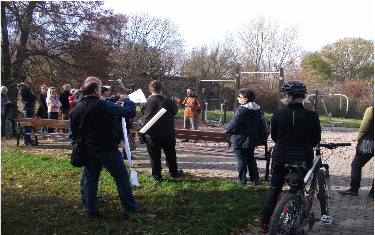
Fot. 3. Okolice os. „Łąkowa”.