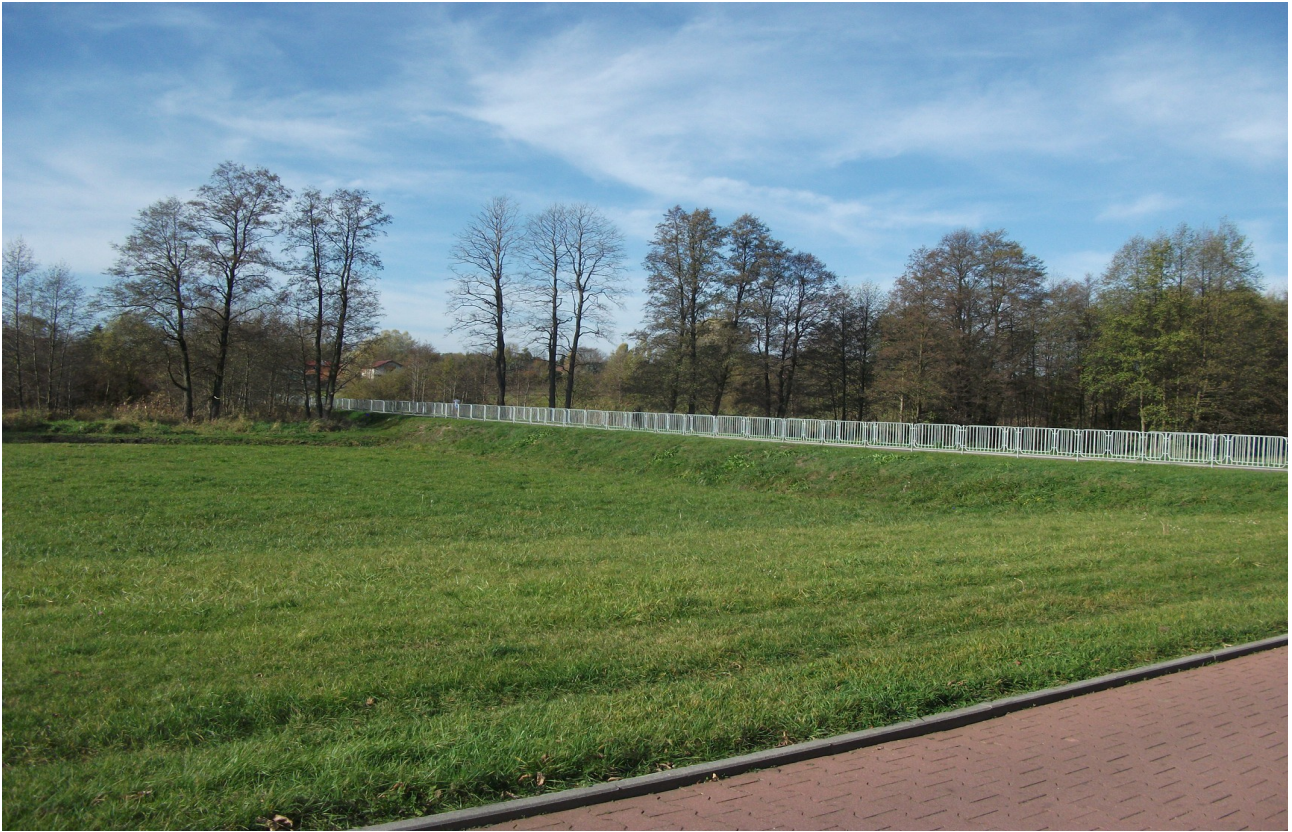
Fot. 13. Ciąg pieszo – rowerowy łączący ul. Parczewską z głównym ciągiem pieszo – rowerowym wzdłuż rz. Bystrzycy.