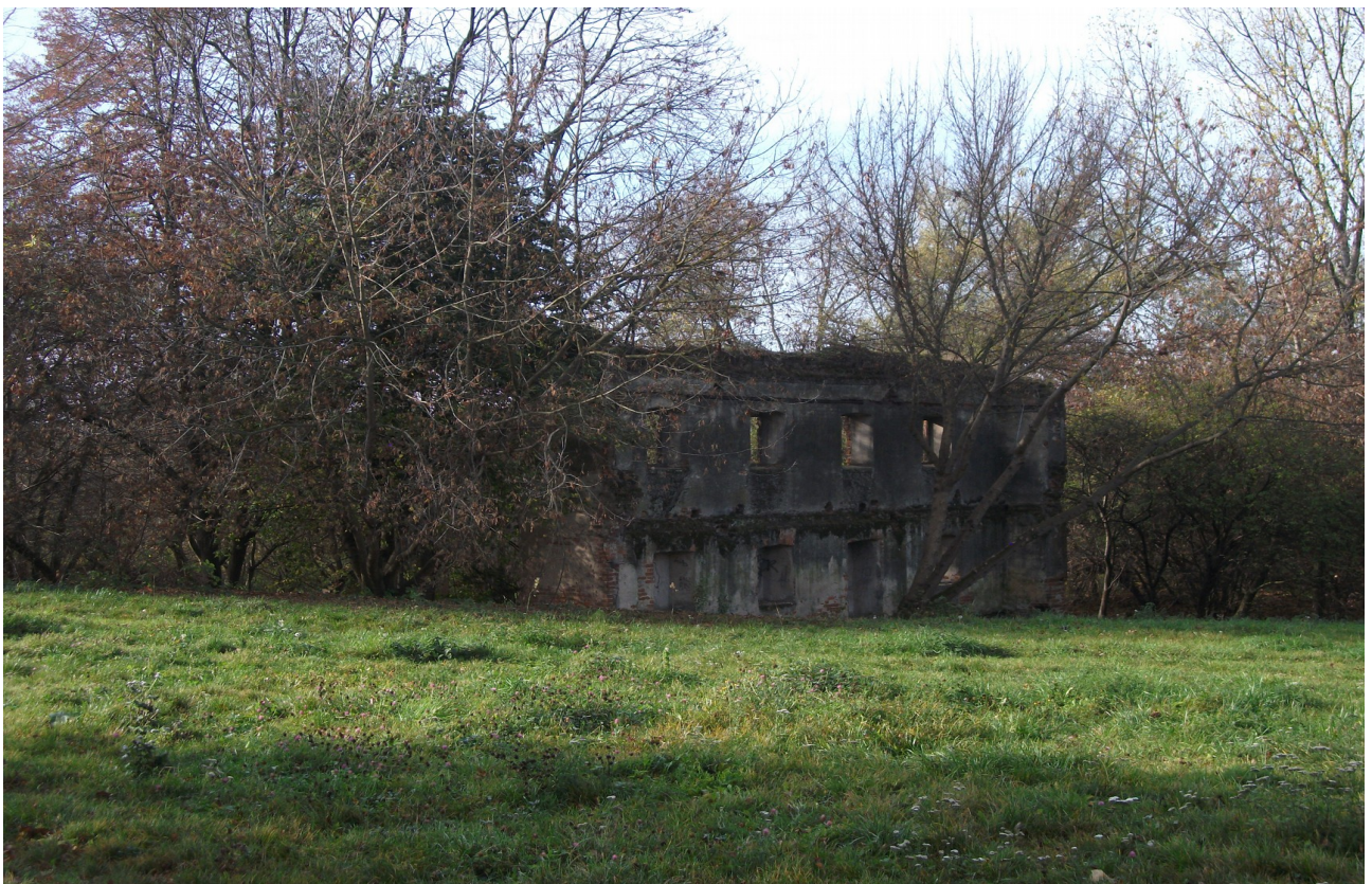
Fot. 4. Ruiny młyna wodnego.