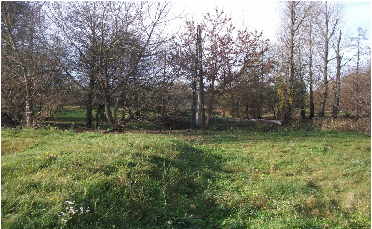
Fot. 5. Okolice os. „Łąkowa” - fragment zbiornika retencyjnego .