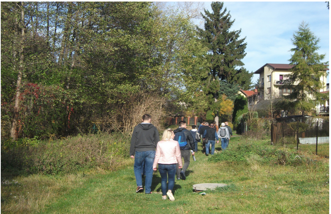
Fot. 16. Wydept wzdłuż rz. Bystrzycy w rejonie ul. E. Romera.