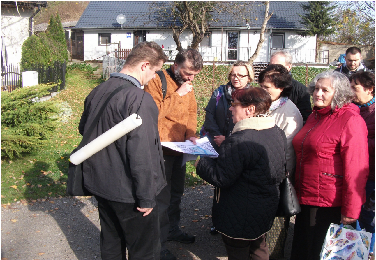
Fot. 9. Rejon ul. Koło.