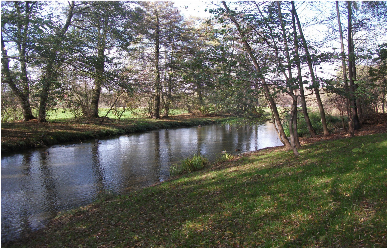
Fot. 15. Rejon ul. E. Romera.