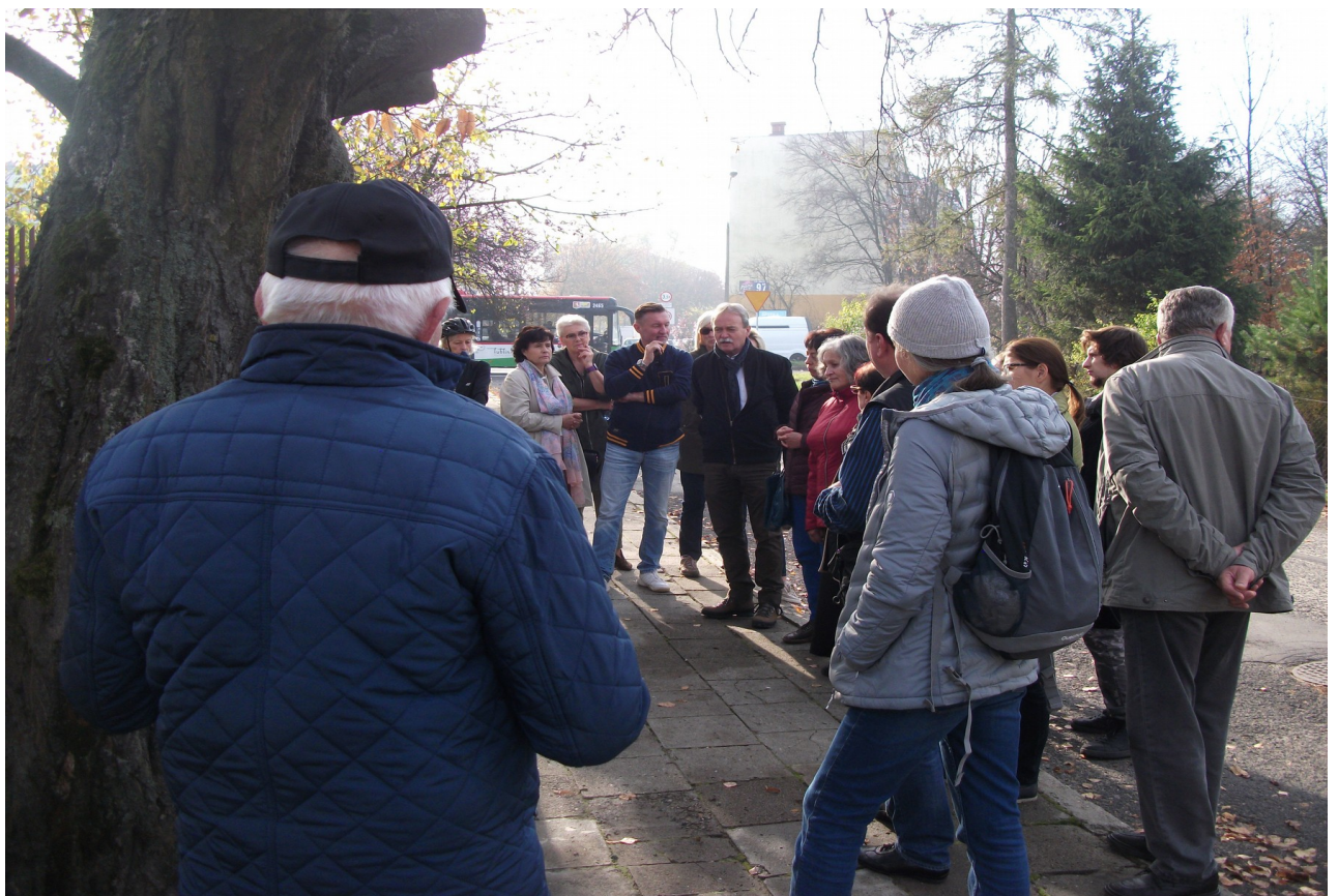
Fot. 2. Miejsce zbiórki przed Środowiskowym Domem Samopomocy, ul. Nałkowskich 78.