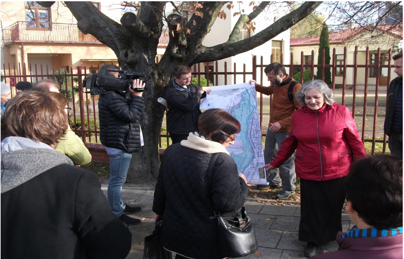
Fot. 1. Miejsce zbiórki przed Środowiskowym Domem Samopomocy, ul. Nałkowskich 78.