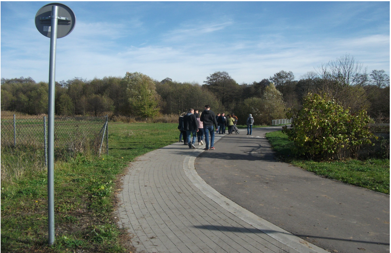
Fot. 12. Ciąg pieszo – rowerowy łączący ul. Parczewską z głównym ciągiem pieszo – rowerowym wzdłuż rz. Bystrzycy.