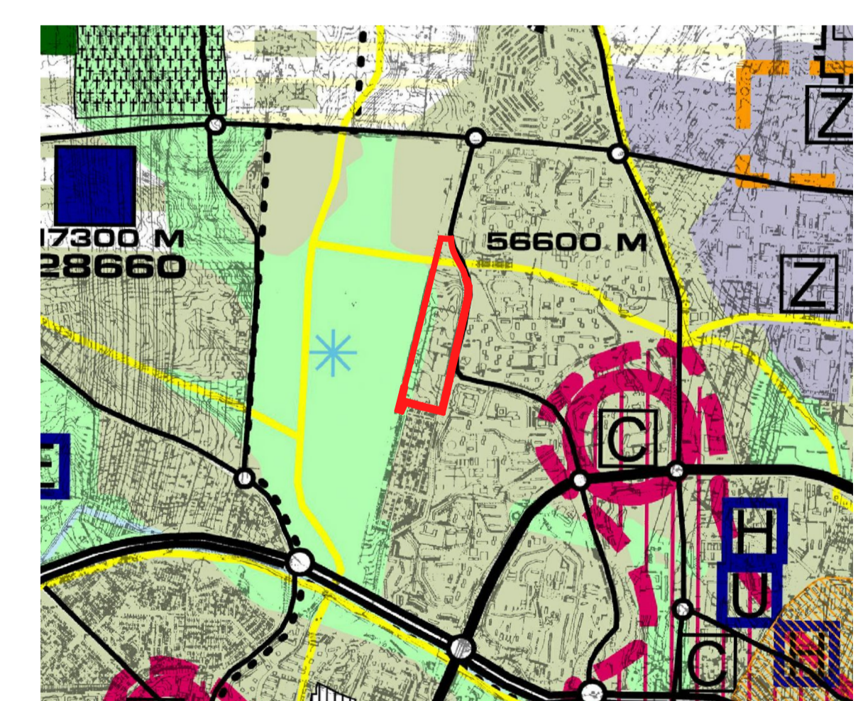
WYKRES ZE STUDIUM URBANIZACJI I KIERUNKÓW ZAGOSPODAROWANIA PRZESTRZENNEGO MIASTA LUBLINA SKALA 1:20000