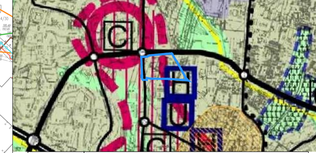
WYRYS ZE STUDIUM UWARUNKOWAŃ I KIERUNKÓW ZAGOSPODAROWANIA PRZESTRZENNEGO MIASTA LUBLIN skala 1:25 000