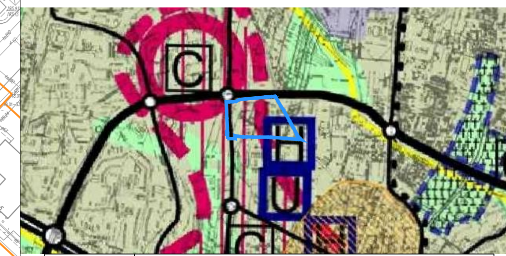
WYRYS ZE STUDIUM UWARUNKOWAŃ I KIERUNKÓW ZAGOSPODAROWANIA PRZESTRZENNEGO MIASTA LUBLIN skala 1:25 000