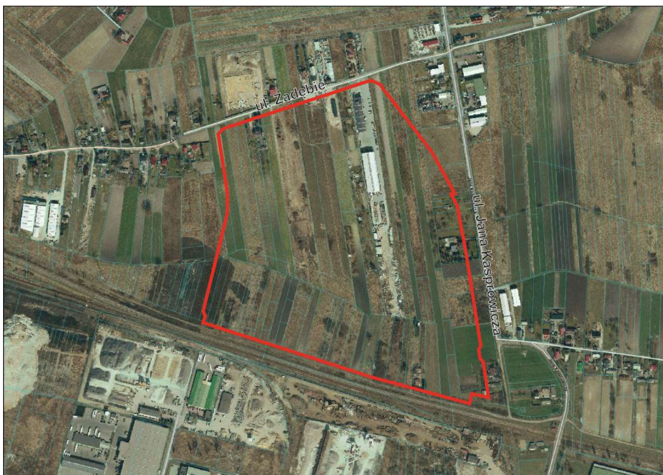
- Granice obszaru opracowania zmiany planu na ortofotomapie.

Zmiana dotyczy obowiązującego miejscowego planu zagospodarowania przestrzennego uchwalonego w dniu 17 marca 2005 r. uchwałą Nr 628/XXIX/2005 Rady Miasta Lublin w sprawie uchwalenia miejscowego planu zagospodarowania przestrzennego Miasta Lublin – część IV. Zmiana planu procedowana jest w oparciu o uchwałę nr 703/XXII/2020 Rady Miasta Lublin z dnia 15 października 2020 r. Tereny będące przedmiotem zmiany planu położone są we wschodniej części miasta Lublin, na północ od terenów kolejowych. Obszar opracowania ograniczony jest ulicą Kasprowicza, ulicą Zadębie oraz planowaną gminną drogą dojazdową (KDD-G) i obejmuje powierzchnię 26,7 ha.