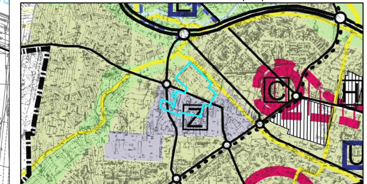
WYRYS ZE STUDIUM UWARUNKOWAŃ I KIERUNKÓW ZAGOSPODAROWANIA PRZESTRZENNEGO MIASTA LUBLIN Uchwała Nr 359/XXII/2000 Rady Miejskiej w Lublinie z dnia 13 kwietnia 2000 r. z późniejszymi zmianami