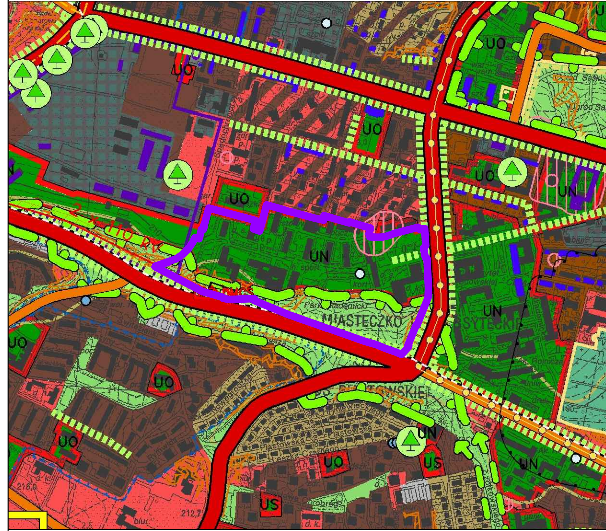
WYRYS ZE STUDIUM UWARUNKOWAŃ I KIERUNKÓW ZAGOSPODAROWANIA PRZESTRZENNEGO MIASTA LUBLIN SKALA 1:10000

ZAŁĄCZNIK NR 1 do Uchwały Nr ...../...../..... Rady Miasta Lublin z dnia ..... 2024 R.