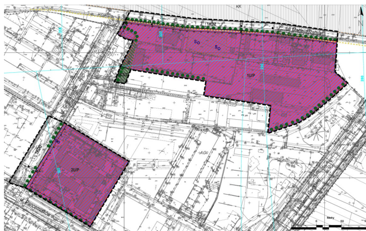
- Projekt zmiany planu.