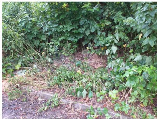
Zaśmiecone oraz uprzątnięte miejsce przy ul. Nałęczowskiej