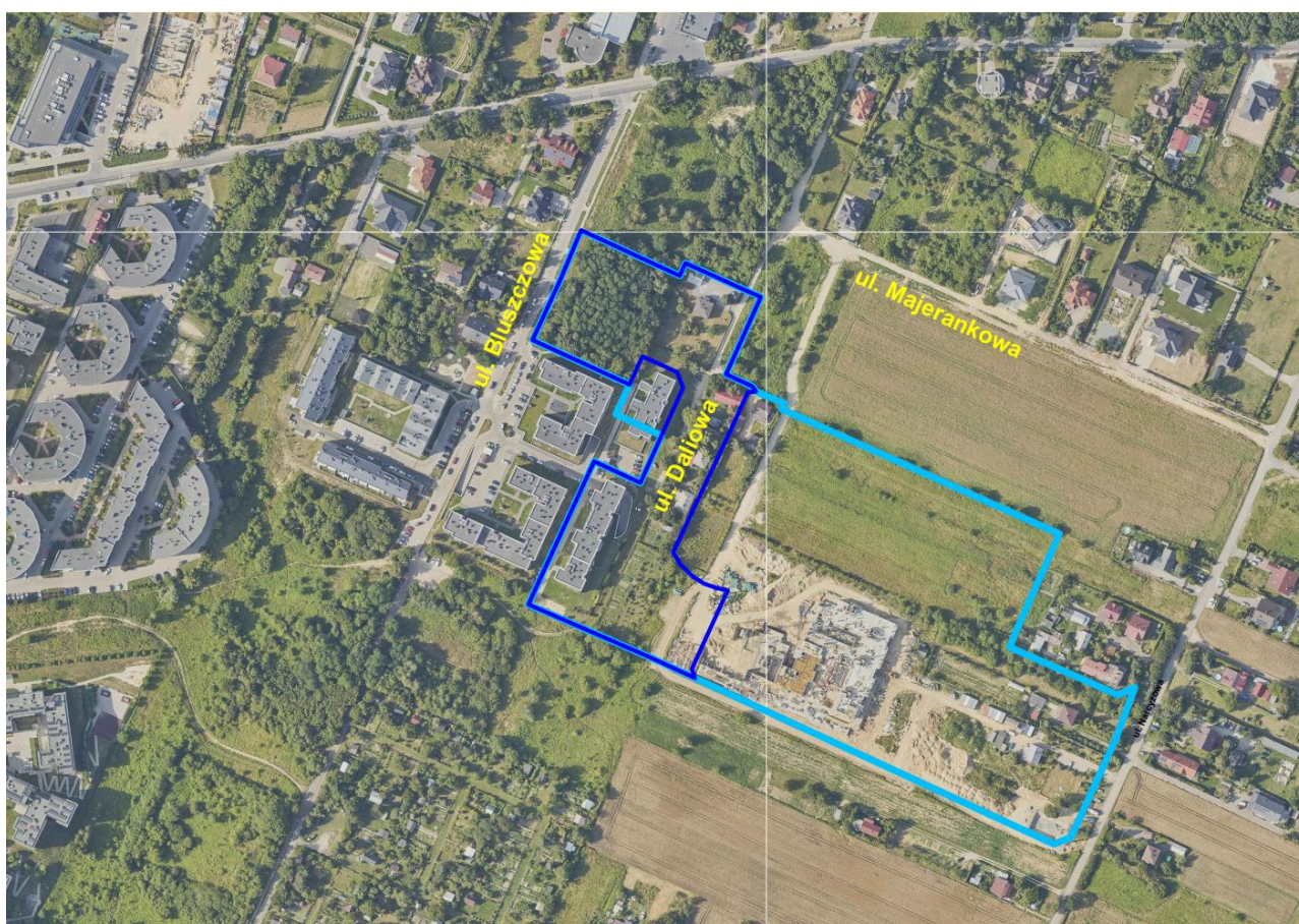
RYSUNEK NR 1

Wnioski zostały rozpatrzone pozytywnie , efektem czego zmniejszeniu uległ obszar opracowania zmiany planu.