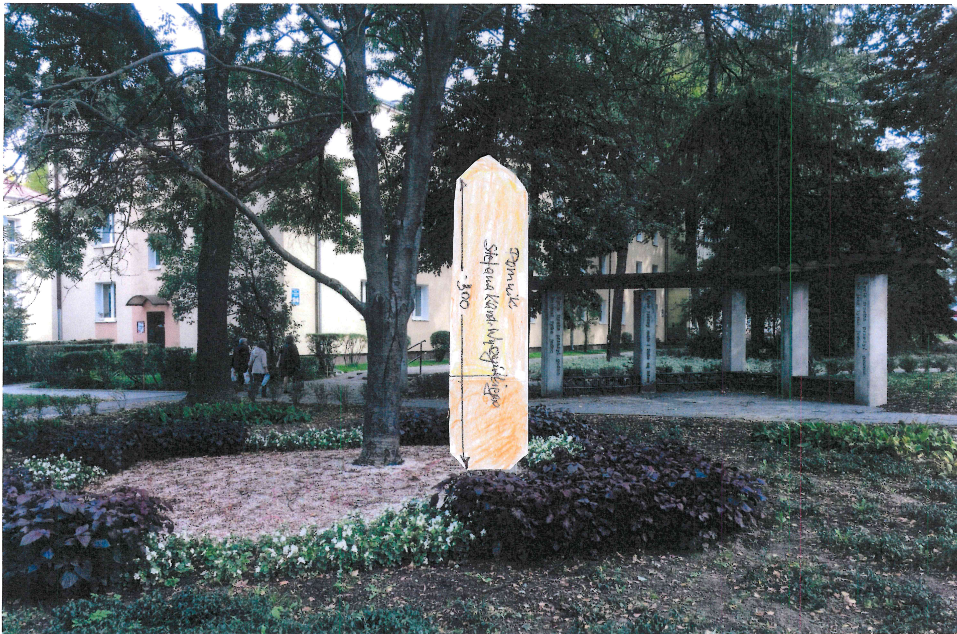
skwer Kardynała Wyszyńskiego przy ul. Męczenników Majdanka w Lublinie, 2017