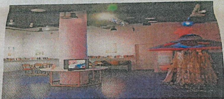
Wystawa odbędzie się w Bibliotece Azyl Galerii Labirynt zlokalizowanej przy galerii handlowej Plaza

To jednak nie wszystko. Otwarcie wystawy zaplanowano na 14 kwietnia o godz. 18, a „uświetnić” ma ją Malamute Kori. Nazwa sugeruje psa, ale nie