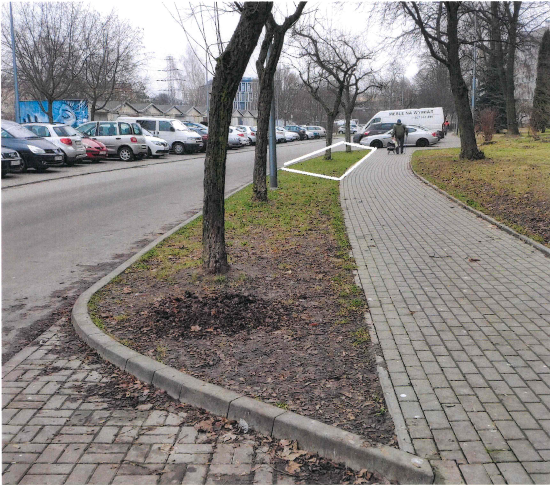
Załącznik nr 3