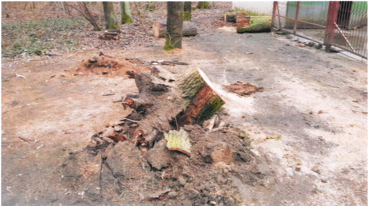
Fot. 2. Pień powalonego dębu