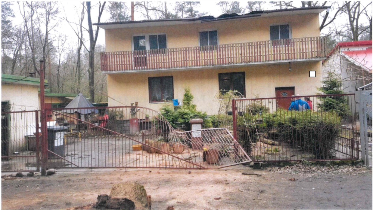
Fot.1. Uszkodzenia domu jednorodzinnego spowodowane upadkiem drzewa