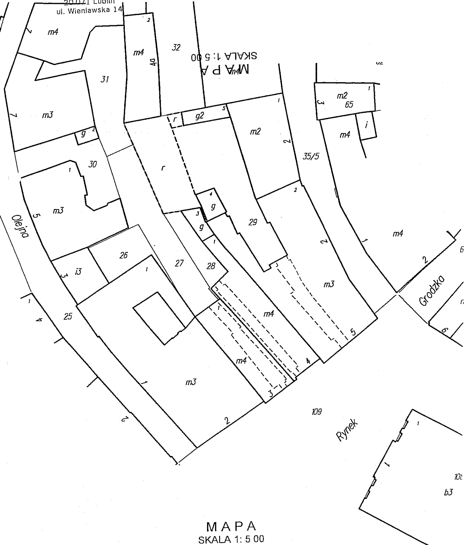
MAPA SKALA 1: 5 00

URZĄD MIASTA LUBLIN Wydział Geodezji 20-071 Lublin ul. Wieniawska 14