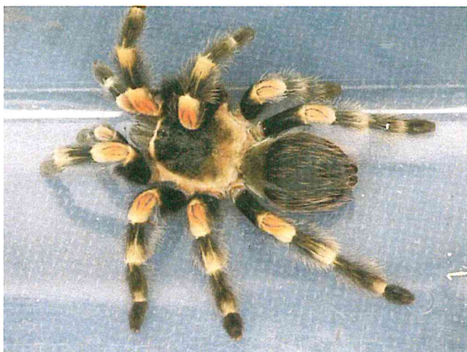
Ilustracja 2: Pająk ptasznik czerwonokolanowy

W dniu 21 czerwca około godz. 12.30 dyżurny Straży Miejskiej otrzymał zgłoszenie o dużym i prawdopodobnie groźnym pająku na trawniku w pobliżu bloku przy ul. Krańcowej. Na miejsce niezwłocznie udali się funkcjonariusze Eko-patrolu Straży Miejskiej. Pająk został odłowiony i przewieziony do schroniska dla zwierząt.