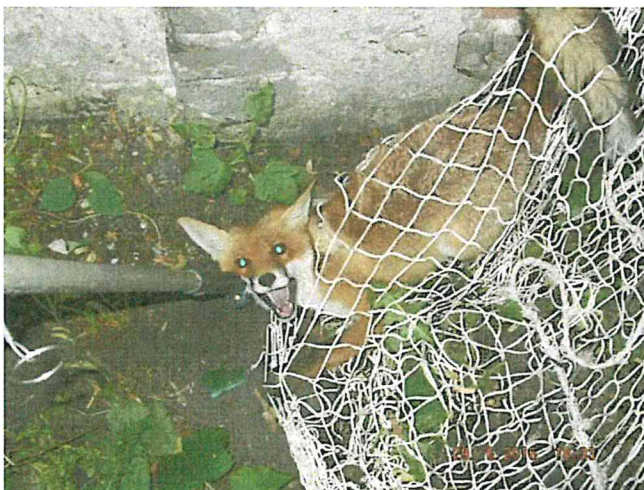
Ilustracja 1: Lis przy ul. Żmigród

W dniu 29 czerwca około godz. 17.30 dyżurny Straży Miejskiej otrzymał zgłoszenie, że przy ul. Żmigród na terenie szkoły lis podchodzi do dzieci. Patrol Straży Miejskiej niezwłocznie udał się na miejsce; wezwano również lekarza weterynarii z Lubelskiego Centrum Małych Zwierząt. Lis został odłowiony około godz. 18.30 i przewieziony do kliniki dla zwierząt przy ul. Stefczyka.