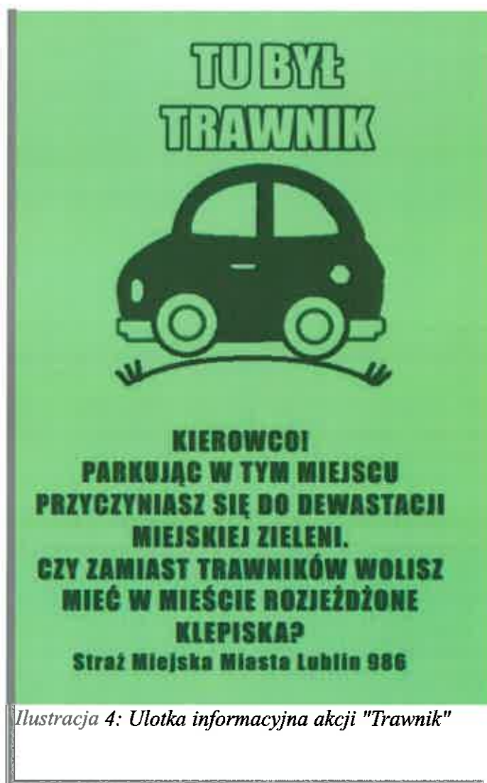
Ilustracja 4: Ulotka informacyjna akcji "Trawnik"

Straż Miejska Miasta Lublin zwraca szczególną uwagę na problem parkowania pojazdów na trawnikach i niszczenia zieleni. Przepisy nie pozwalają jednak na ukaranie kierowcy, który pozostawił swój pojazd w miejscu, w którym zieleń została już uprzednio zniszczona (tzw. klepisko). W tym przypadku Straż Miejska pozostawiała ulotki informacyjne, które były formą oddziaływania prewencyjnego i miały za zadanie uświadomienie kierowcy, że jego zachowanie wpływa na wizerunek miasta.