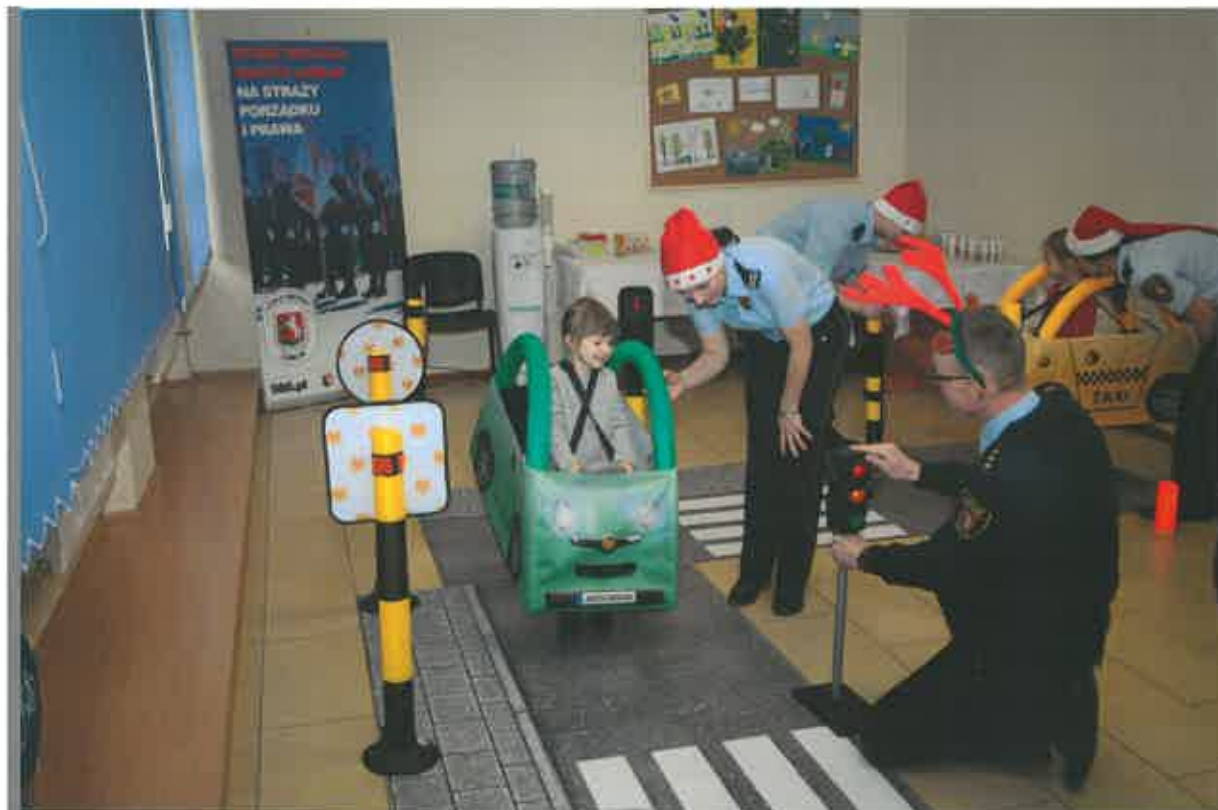
Ilustracja 9: Zabawa edukacyjna z Autochodzikiem

Głównym fundatorem upominków dla dzieci była SIPMA S.A.