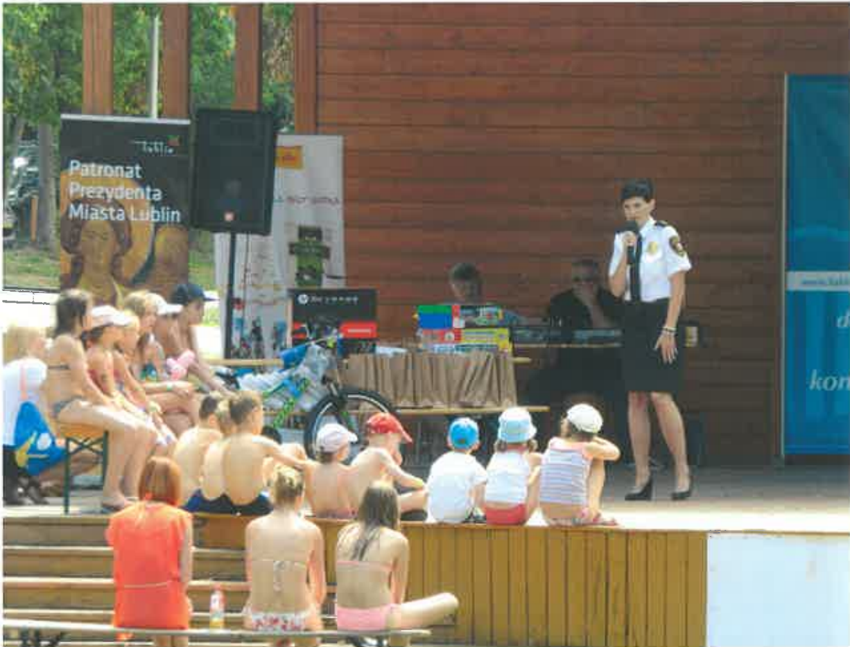
Ilustracja 8: Festyn "Bezpieczne lato" - konkurs na temat bezpieczeństwa