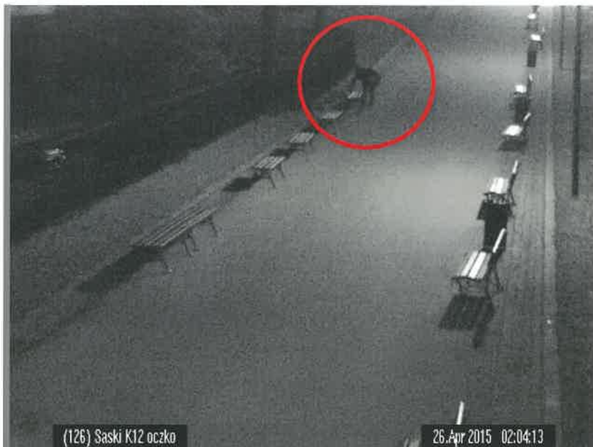
Ilustracja 10: 26 kwietnia 2015 - wandal niszczący ławkę w Ogrodzie Saskim