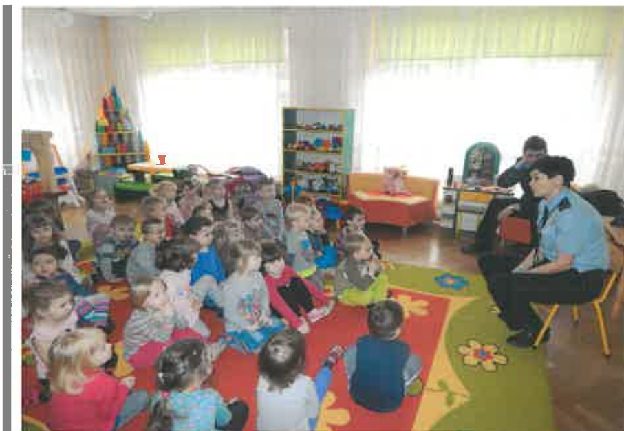
Ilustracja 6: Pogadanka w przedszkolu nr 42