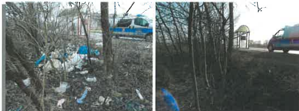
Ilustracja 1: Ul. Rataja – teren przed i po uprzątnięciu

W dniu 22 lipca patrol Straży Miejskiej otrzymał informację o wysypisku odpadów znajdującym się przy ul. Skrzynickiej. Strażnicy przeszukali śmieci i znaleźli w nich dokumenty, które pozwoliły na zidentyfikowanie sprawcy ich podrzucenia. Sprawca został ukarany mandatem w wysokości 200 zł, a także zobligowany do uprzątnięcia podrzuconych odpadów.