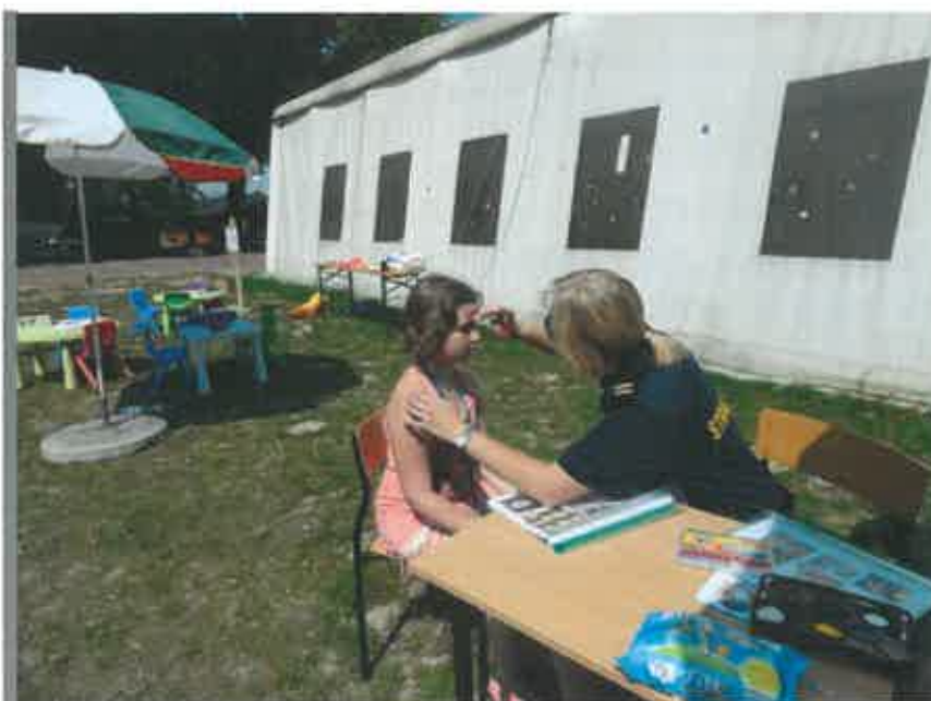
Ilustracja 7: Festyn "Bezpieczne lato" - malowanie twarzy

W dniu 18 lipca 2015 r. na Słonecznym Wrotkowie odbył się festyn dla dzieci „Bezpieczne Lato”, zorganizowany wspólnie przez Straż Miejską Miasta Lublin oraz Państwową Inspekcję Pracy – Okręgowy Inspektorat Pracy w Lublinie. W trakcie festynu dzieci miały okazję brać udział w konkursach na temat bezpieczeństwa, obserwować pokazy technik samoobrony, uczestniczyć w zabawach sportowych oraz oglądać pokazy WOPR-u, Policji i Straży Pożarnej.