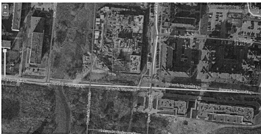
Rys. 1. Przebieg ulicy Bernarda Wapowskiego (na podstawie geoportal2.lublin.eu)

Z uwagi na powyższe wnosimy o wykonanie brakującego odcinka ulicy Wapowskiego, która dotyczy jedynie 160 metrów bieżących (wraz z chodnikami). Jest to niezwykle potrzebna inwestycja dla mieszkańców osiedla Zielonego i prosimy władze miasta o realizację naszego wniosku.