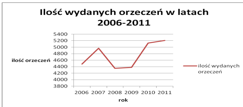
Wykres 2. Liczba wydanych orzeczeń w latach 2006 – 2011.