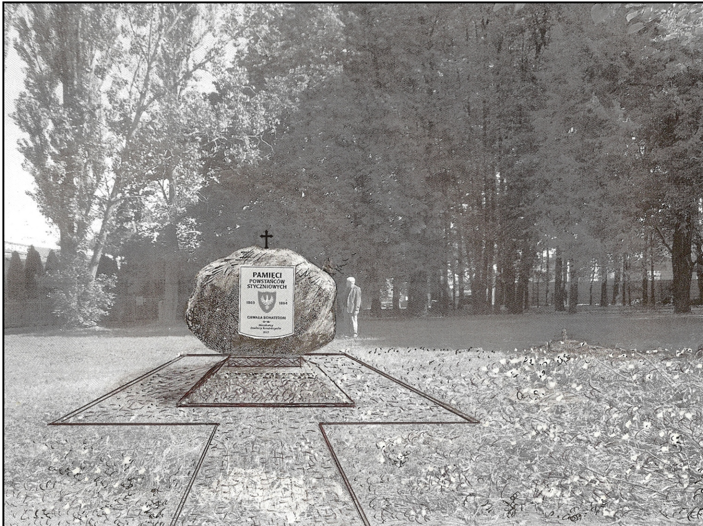
PROJEKT OBELISKU upamiętniającego 150 rocznicę Powstania Styczniowego 1863 roku Usytuowanie: skwer u zbiegu ul. Bohaterów Monte Cassino i Alei Krańnickiej Wizualizacja - skala 1:50 proj. Kazimierz Stasz, Jaromir Stasz