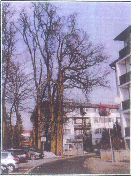
Fot.1.Dąb PP na łuku ul.Kieleckiej