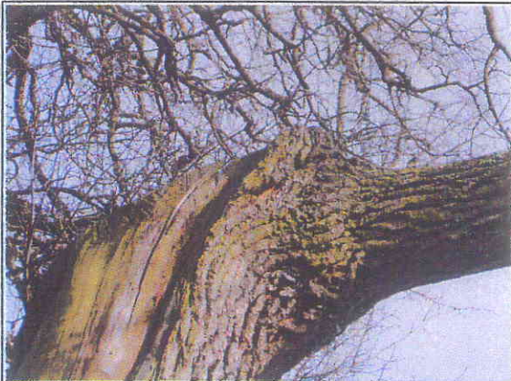
Fot.11 Widoczne pęknięcie drewna w miejscu osadzenia najwyższego konaru