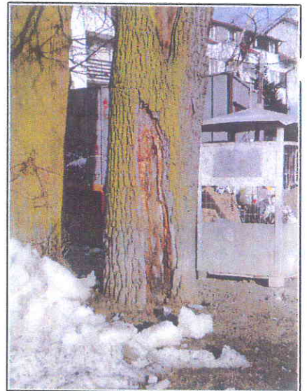
Fot.6 Ubytek w dolnej partii pnia