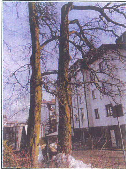
Fot.2 Dąb Pomnik Przyrody nr 380