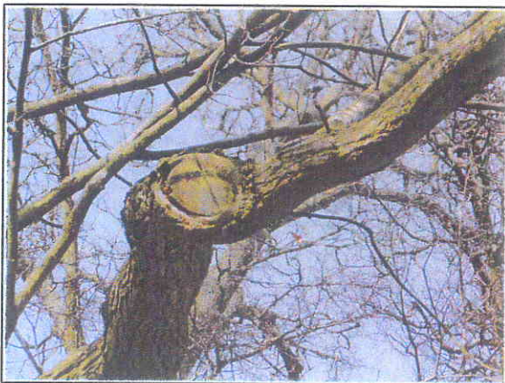
Fot.7 Wyróchnienia w miejscu odciętych konarów