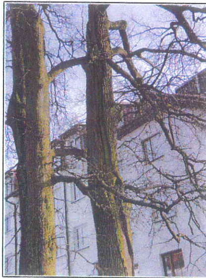
Fot.5 Listwa piorunowa na pniu