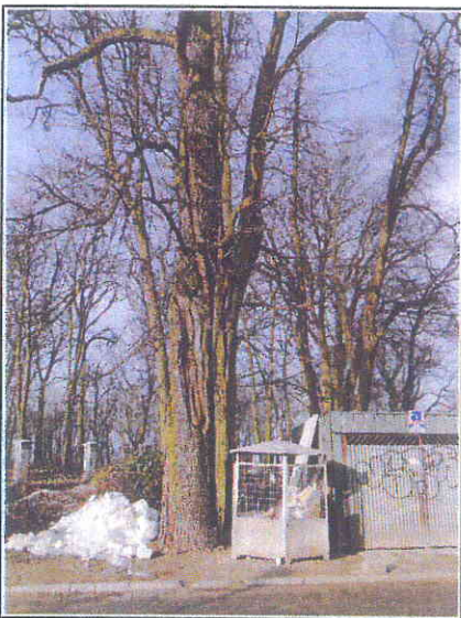
Fot.4 Pień drzewa od strony wschodniej