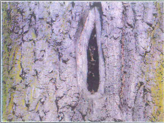
Fot.9 ubytek w koronie drzewa