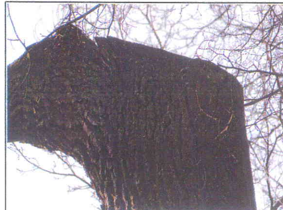
Fot.12 To samo-widok z przeciwnej strony