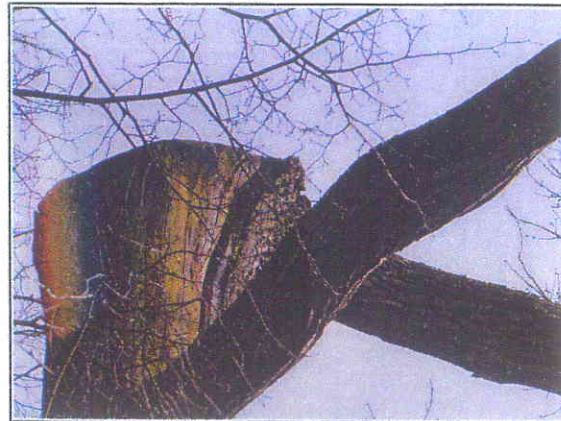
Fot.10 Miejsce odcięcia wierzchołka