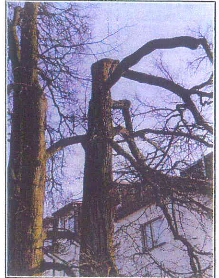
Fot.3 Pozostały fragment korony drzewa