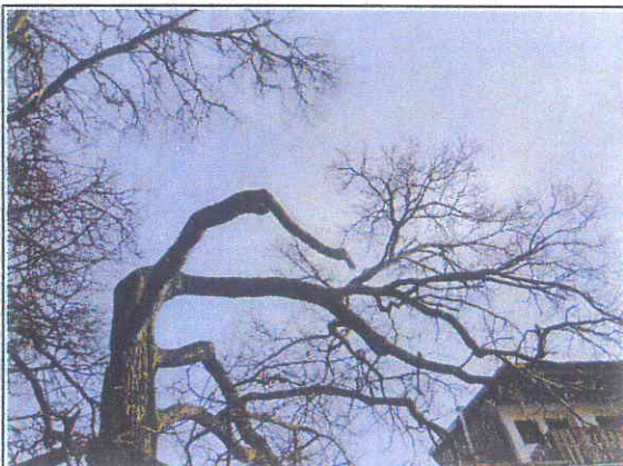
Fot.13 uschnięty konar szkieletowy