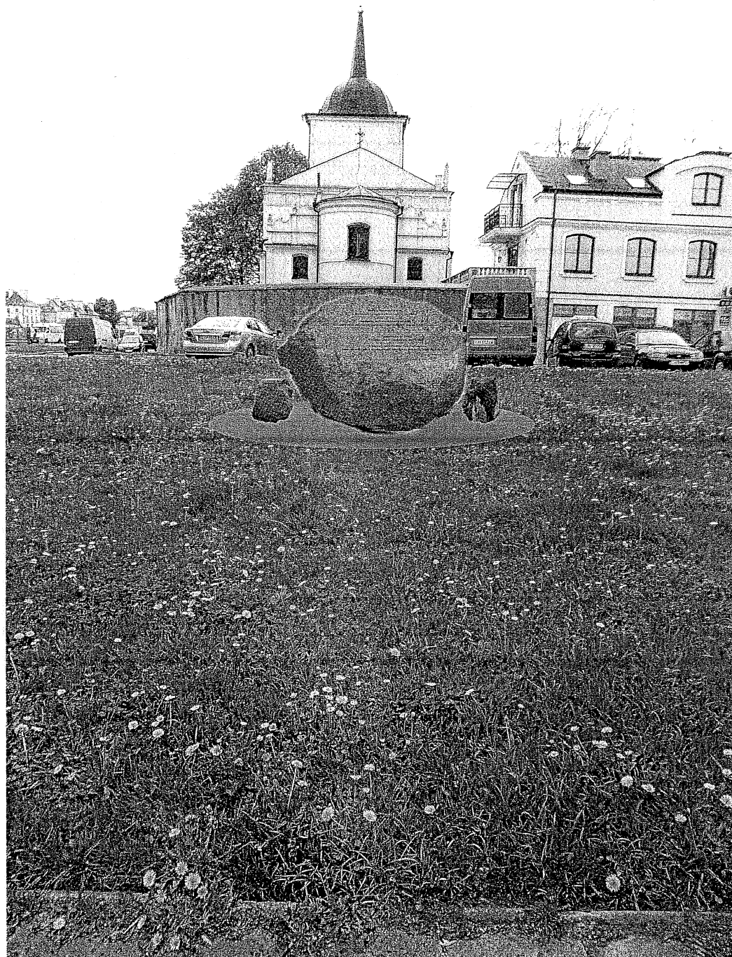
WIZUALIZACJA LOKALIZACJI PROJEKTOWANEGO POMNIKA