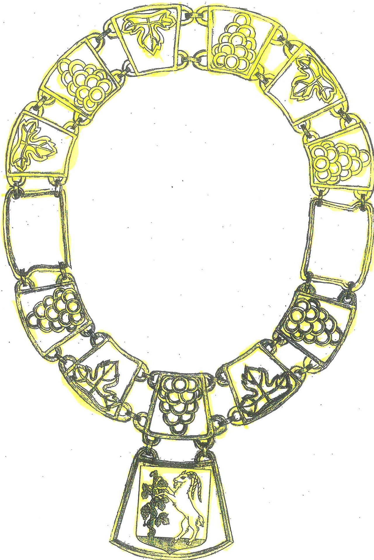
Łańcuch Prezydenta Miasta Lublin – wersja złota