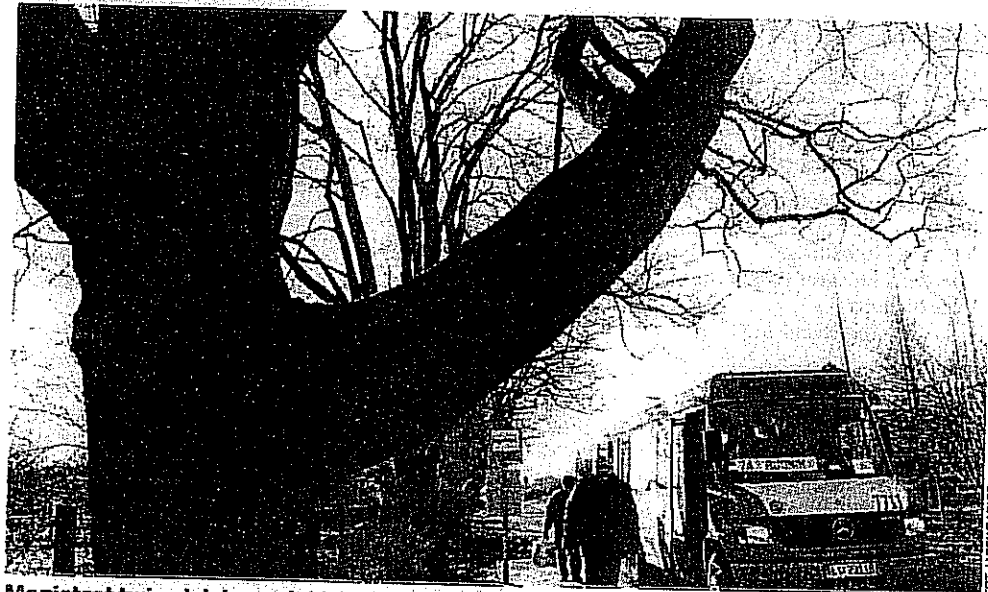
Magistrat twierdzi, że wycinki drzew uda się uniknąć

Stowarzyszenie Inżynierów i Techników Komunikacji RP Oddział w Lublinie przedłożyło projekt zagospodarowania tego terenu. Wskazało w nim do wycinki blisko 20 drzew, w tym okazałe klony. W Zarządzie Dróg i Mostów usłyszeliśmy, że to właśnie stowarzyszenie oznaczało drzewa farbą. Chodziło o wyróżnienie tych, które były