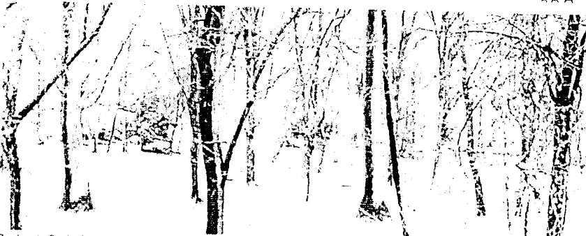
Zamknięty Ogród Saski

Marcin Bieleśz 25.02.2012 aktualizacja: 24.02.2012 18:01