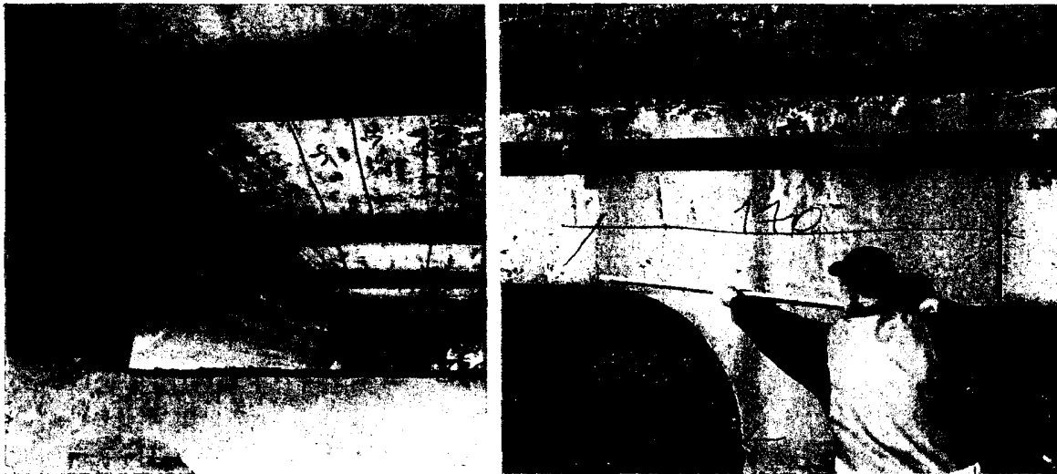
Rys. 77-78. Pomiary inwentarycyjne

Przeprowadzono inwentaryzację wymiarów mostu, wymiary uwidoczniiono na Rys. 71. Na zamieszczony poniżej rysunkach pominięto istniejące czynne bądź nie czynne rury instalacji prowadzących media. W przekroju poprzecznym most ma 4 rzędy słupów o przekroju kwadratowym o boku 40 cm z fazowanymi narożami na głębokość 2,5 cm.