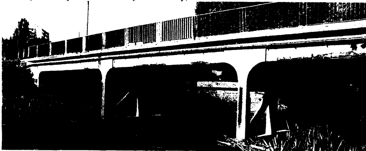
Rys. 70. Widok mostu na Kalinowszczyźnie od napływu; stan - 2013 r.

O tym moście wiadomo bardzo mało. W Archiwum Miasta Lublina są tylko szczątkowe dokumenty, które w sensie technicznym nie wnoszą praktycznie nic. Z racji usytuowania poza miastem nie ma też artykułów czy choćby wzmianek w lokalnej prasie. Stąd wiadomo na pewno, że firma M. Lutosławskiego została wybrana na wykonawcę w drodze przetargu i ukończyła most po sześciu miesiącach budowy, w terminie.