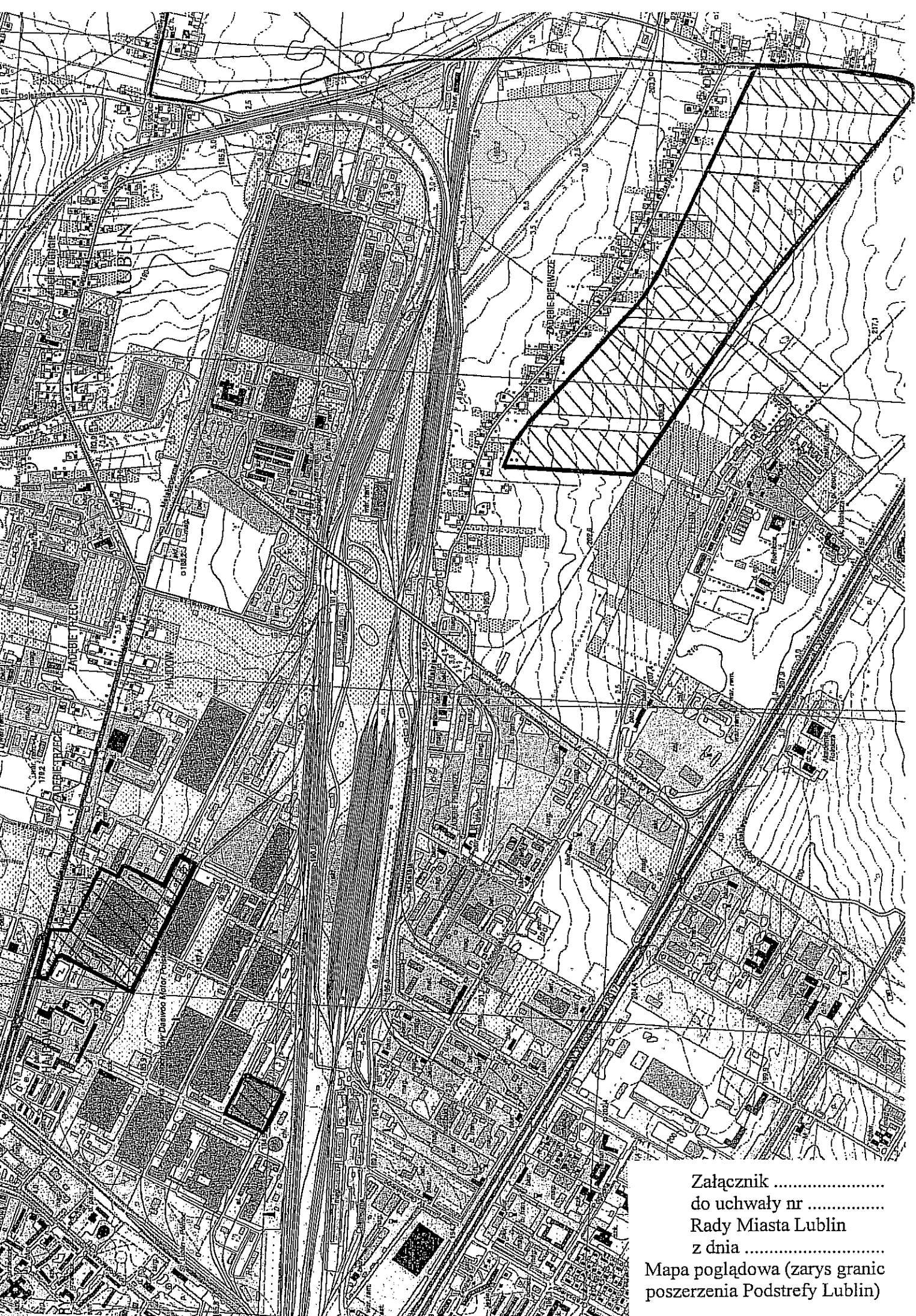
Załącznik ..... do uchwały nr ..... Rady Miasta Lublin z dnia ..... Mapa poglądowa (zarys granic poszerzenia Podstrefy Lublin)