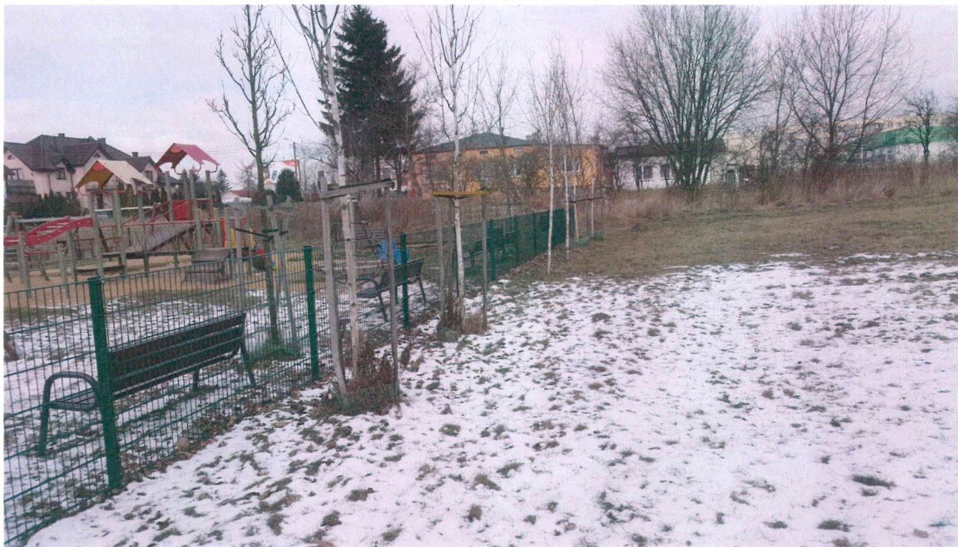
Fot. 3. Nasadzenia z tyłu ogrodzenia placu.