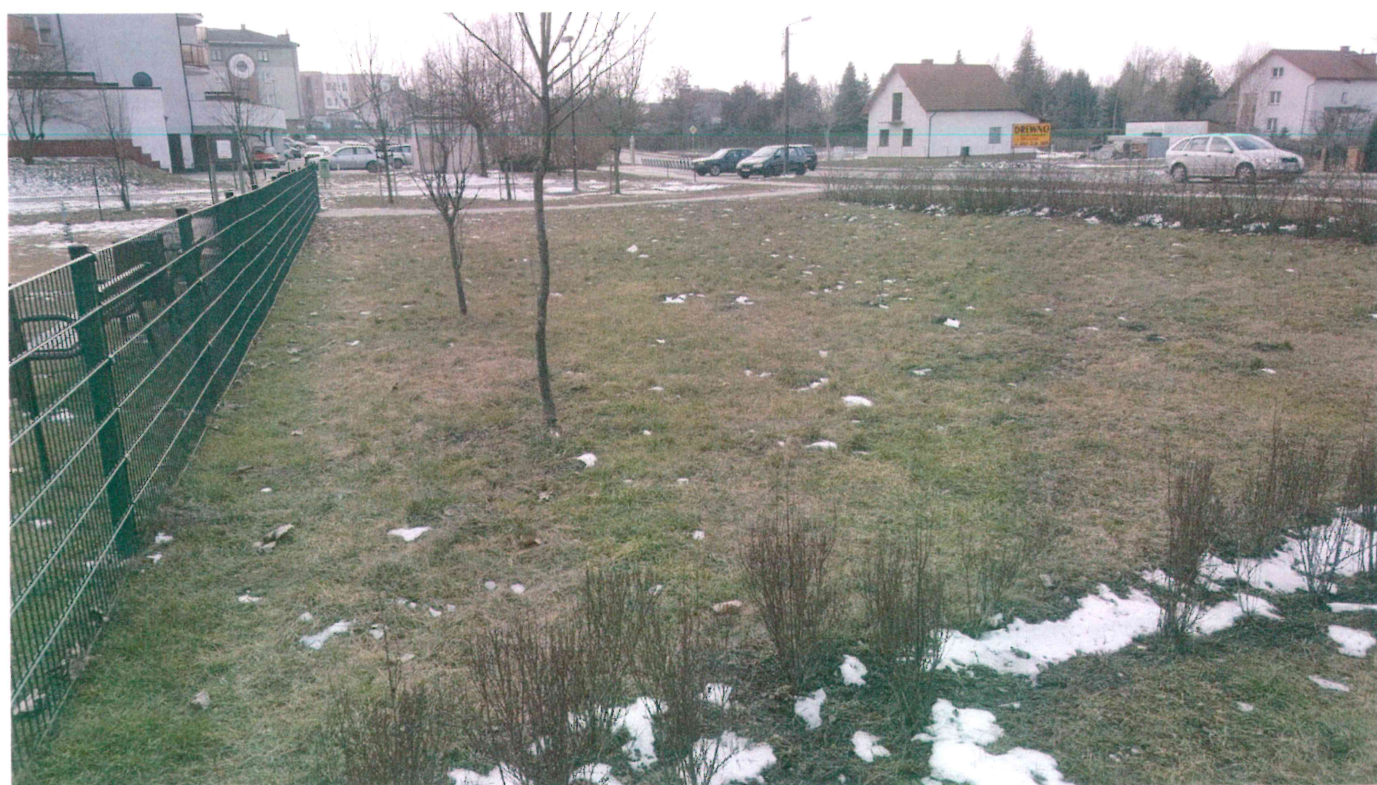
Fot. 2. Miejsce ewentualnych nasadzeń.