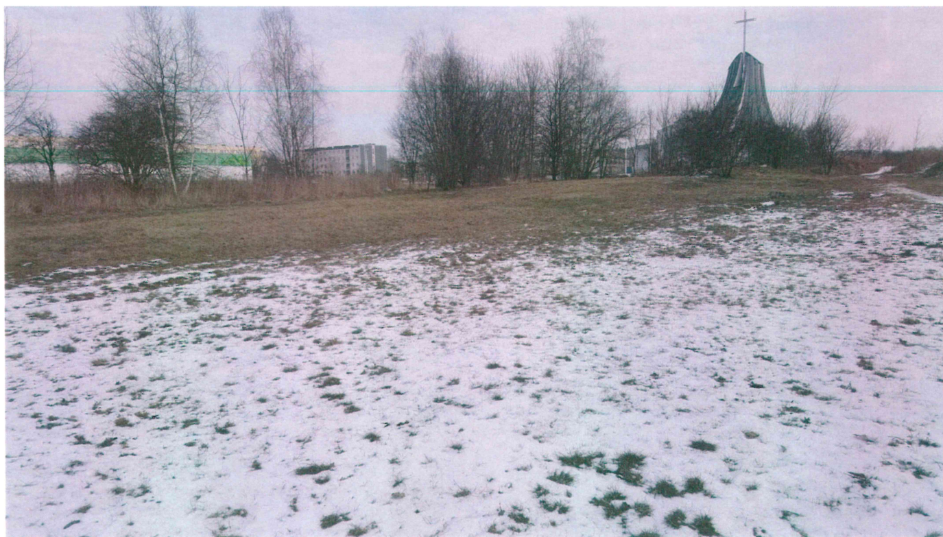
Fot. 4. Wyniesienie w miejscu przyszłej siłowni.