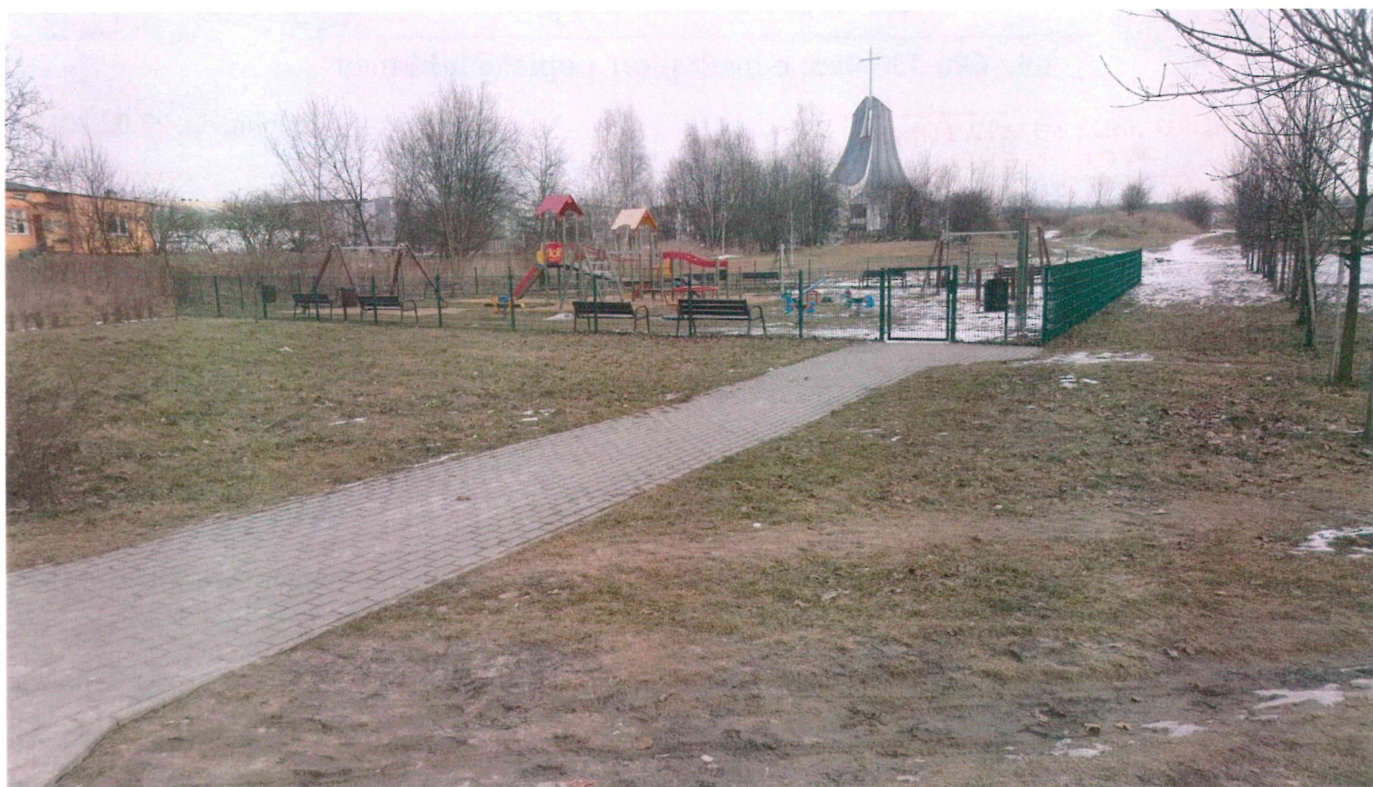
Fot. 1. Plac zabaw przy ulicy Nałkowskich w okolicach osiedla Słoneczny Dom.