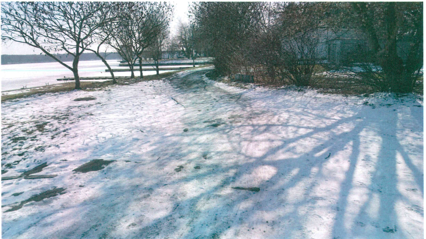
Fot. 4. Miejsce umożliwiające chwilowe zatrzymanie pojazdu i zawracania