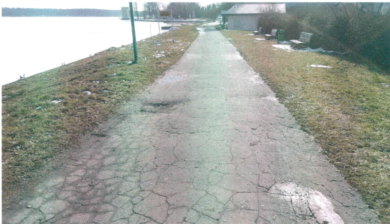
Fot. 1. Spękana nawierzchnia alejki na Zalewem Zemborzyckim.