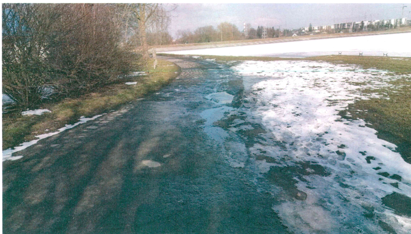
Fot. 2. Dojazd do miejsca wodowania.