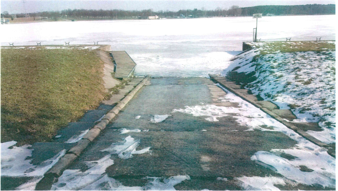
Fot. 3. Miejsce wodowania łodzi nad Zalewem Zemborzyckim od strony Mariny.