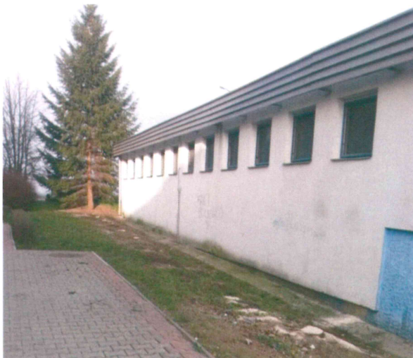
Rys. 1. Miejsce wycinki – działka nr 98, arkusz 7, obręb 43 (fot. z dnia 18.12.2017 r.).