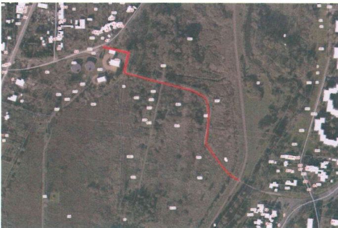
Rys. 1. Dojście do ulicy Koło, na podstawie fotoplanu z 2014 r.

Doceniając wkład pracy zespołu planistycznego w rozwój naszego miasta proszę również o udzielenie informacji o ewentualnej lokalizacji ciągów pieszych, bądź pieszo-jezdnych, jakie zostały wkomponowane w tym terenie celem połączenia tego obszaru miasta z os. Nałkowskich (w dokumentach archiwalnych). Pozostawianie tej sprawy bez docelowego wskazania nawet niewybudowanych ciągów pieszych będzie negatywnie odbijać się na poziomie życia naszych mieszkańców przez długi czas.