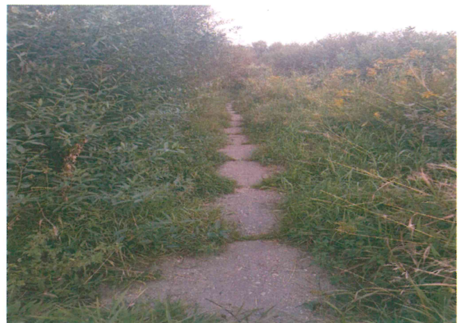
Rys. 2. Dojście do ulicy Koło, stan na dzień dzisiejszy