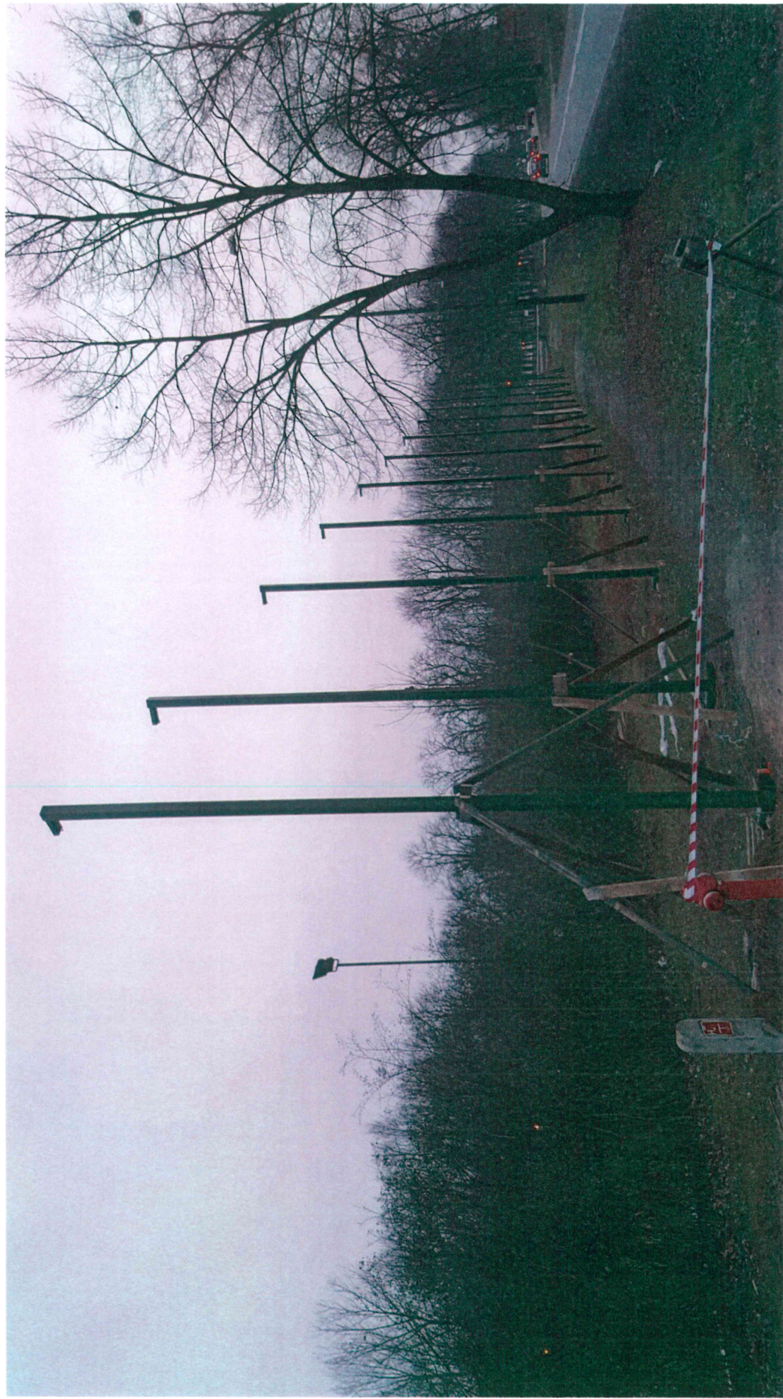
Rys. 1. Powstająca konstrukcja piłkochwytyw w pobliżu boiska do piłki nożnej przy ulicy Krężnickiej (10.01.2018 r.)