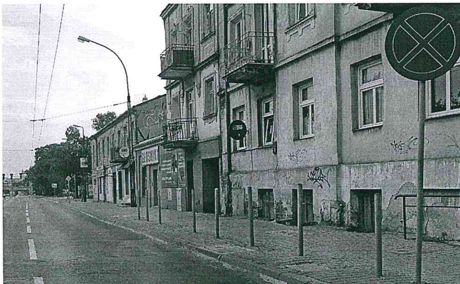
Rys. 1. Znak B-36 umieszczony w pasie drogowym ulicy Kunickiego

Uprzejmie proszę o dodanie tabliczki nie dotyczy zaopatrzenia pod znakiem (zakaz zatrzymywania się) usytuowanym przy ul. Kunickiego na odcinku od ul. Chłodnej do ul. Skośnej. Ograniczenie zakazu w czasie załadunku i wyładunku ułatwiłoby pracę kurierom dostarczającym przesyłki, oraz dla mnie stanowiłoby ułatwienie w zaopatrzeniu sklepu. Informuję, że chodnik w tym miejscu ma szerokość ponad cztery metry. Proszę o pozytywne rozpatrzenie mojej prośby.