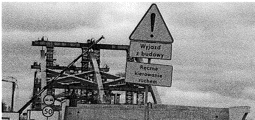
Rys. 1. Przykładowe oznakowanie wprowadzone na czas robót budowlanych dopuszczające ręczne kierowanie ruchem.

Pozostaję również na stanowisku, iż w przypadku prowadzenia dużych robót drogowych najlepszym rozwiązaniem jest ręczne kierowanie ruchem (minimum w godzinach szczytu). Takie rozwiązanie pozwala na ocenę tworzących się korków i podejmowanie elastycznych decyzji. Niezrozumiałym jednocześnie jest dla mnie odpowiedź udzielona na zapytanie skierowane na sesji Rady Miasta Lublin w dniu 26 kwietnia b.r. (pismo znak: OR-ZU-II.0003.2.4.2018 z dnia 8 maja b.r.), w którym wskazane zostało, iż do kierowania ruchem uprawniona jest jedynie Policja. Proszę zatem o dodatkową interpretację przekazanej odpowiedzi.