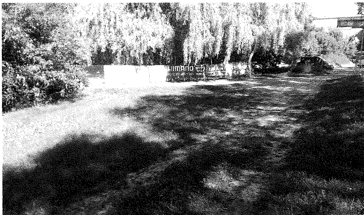
Rys. 1. Propozycja odbioru nieczystości z działki nr 60/6, arkusz 3, obręb 35 z dobrym dojazdem od ulicy Janowskiej

Podjęta w ubiegłym roku oddolna inicjatywa cieszyła się bardzo dużym zainteresowaniem i zaowocowała uprzątnięciem koryta na odcinku od zapory czołowej Zalewu Zemborzyckiego do wiaduktu kolejowego przy ulicy Janowskiej. W tym roku zarządca rzeki tj. Państwowe Gospodarstwo Wodne Wody Polskie poprzez firmę Ekoland Sp. z o.o. dokona odbioru zebranych śmieci. Biorąc pod uwagę warunki techniczne, jak również miejsce końcowe spływu zwracam się z uprzejmą prośbą o wyrażenie zgody na ustawienie kontenera o pojemności 7m 3 na działce nr 60/6, arkusz 3, obręb 35 w dniach 1 - 4 czerwca b.r.